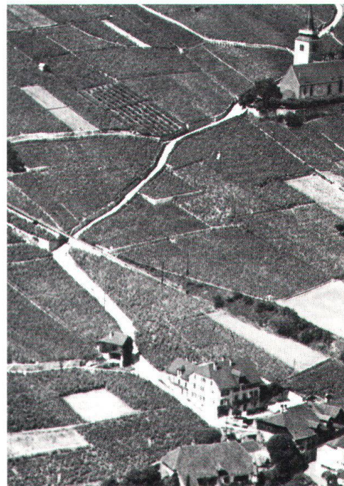
La remise à plus tard d'une double voie CFF à Gléresse ne signifie pas que la «bataille» pour ce joyau des bords du lac de Bienne soit gagnée.

cachet. Un charme particulier est conféré au site par la situation unique de la vénérable église gothique , perchée au milieu des vignes à bonne distance au-dessus des maisons du village, construites en pierre d'Hauterive dorée, couvertes de tuiles plates, et étroitement serrées les unes contre les autres. Fait également partie de cet harmonieux tableau la toute proche île de St-Pierre, avec sa colline boisée, et les souvenirs historiques d'un ancien couvent clunisien et de J.-J. Rousseau. C'est à juste titre que toute la région a été inscrite en 1967 à l'inventaire des sites d'importance nationale, comme objet N° 142 («Pied du Jura et lac de Bienne»), que le Canton de Berne a choisi Gléresse parmi ses «réalisations exemplaires» de l'Année eu-