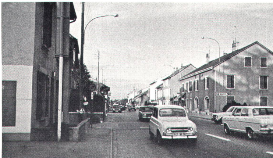
Le centre du village de Plan-les-Ouates.