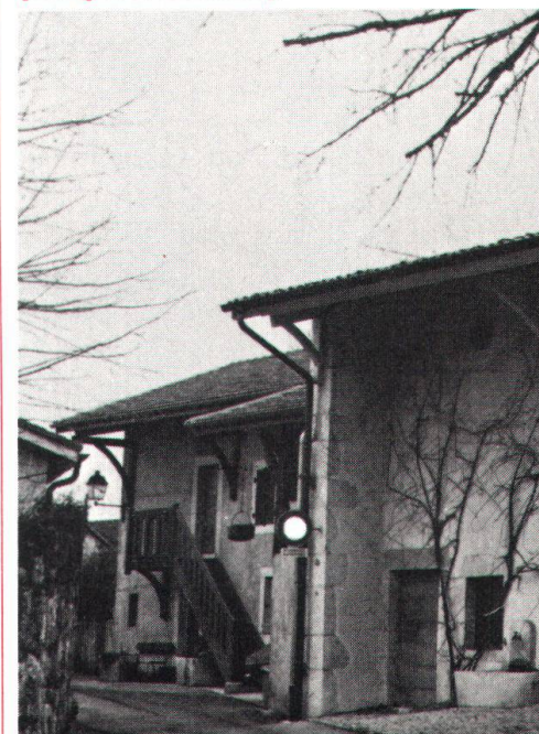
Ci-dessous: succession de maisons typiques.

Situé sur une crête, le village de Dardagny domine le site (protégé) du vallon de l'Allondon . Le déve-