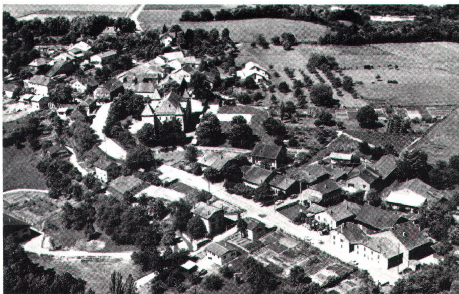
Ci-dessus: La division de l'ancien village de Dardagny en deux parties, reliées par l'église et le château, est encore visible aujourd'hui.