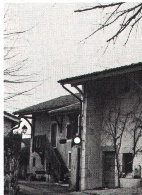
Ci-dessous: succession de maisons typiques (photo Bodinier).

Situé sur une crête, le village de Dardagny domine le site (protégé) du vallon de l' Allondon . Le déve-