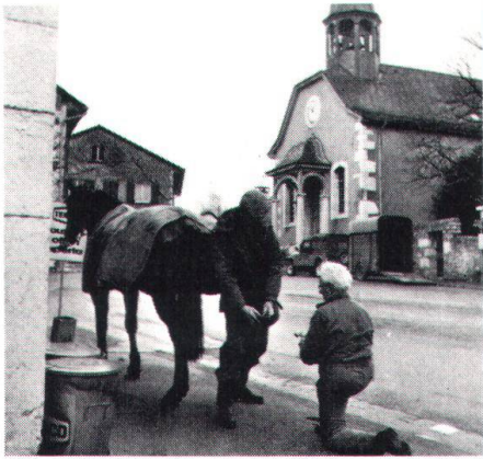
Der Hufschmied ist in Dardagny nicht der einzige Handwerker, der sich bis in unsere Tage erhalten konnte.

wicklung des Schlosses. Jede der beiden Festungen war Sitz einer Herrschaft und teilte die Gemeinde in zwei Hälften, die noch heute erkennbar sind. Zwischen dem Süd- und dem Nordteil eingebettet sind die Kirche und das Schloss.