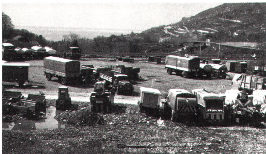
Dépôt illégal de camions et machines en zone de villas.

Au «pré Blanc», magnifique parcelle de verdure, une S.A. dépendant d'une grande coopérative projette un centre commercial de 26 000 m 2 , avec parc pour 1200 voitures. Dans ce cas, une personne