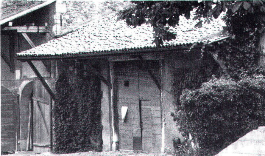
Village de Landecy. La maison rurale genevoise possède des caractéristiques pour une part mises en évidence par les relevés effectués en 1922/23 par P. Aubert.

(Petit-Sionnet, Les Mévaux), Lancy , Landecy , Sezegnin , Vernier , Versoix . D'autres villages ou sites urbains sont en cours de recensement: le Vieux-Carouge, la Corrairie, le quai des Bergues, le hameau de Chamlong (près de Chaney). En ville, ce recensement est déjà achevé en ce qui concerne le quartier place Grenus, rue des Étuves.