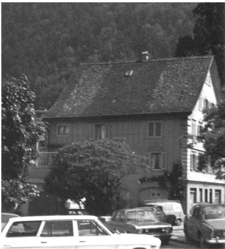
La «Lehnplatz» d'Altdorf; à l'arrière-plan, le groupe de séquoias illégalement abattu.

... Et pourtant nous vivons en un temps peu favorable aux arbres. Non seulement pour des raisons économiques (les forêts diminuent), mais aussi parce que notre temps est celui d'un extraordinaire gaspillage. Cela correspond à sa double tendance à la hâte et au nivellement: ce qui est élevé doit être abaissé, et l'âge perdre son prestige. L'arbre, par sa hauteur, est analogue au père, et avec lui tombent toutes les valeurs que symbolisait le père (Ernst Jünger).