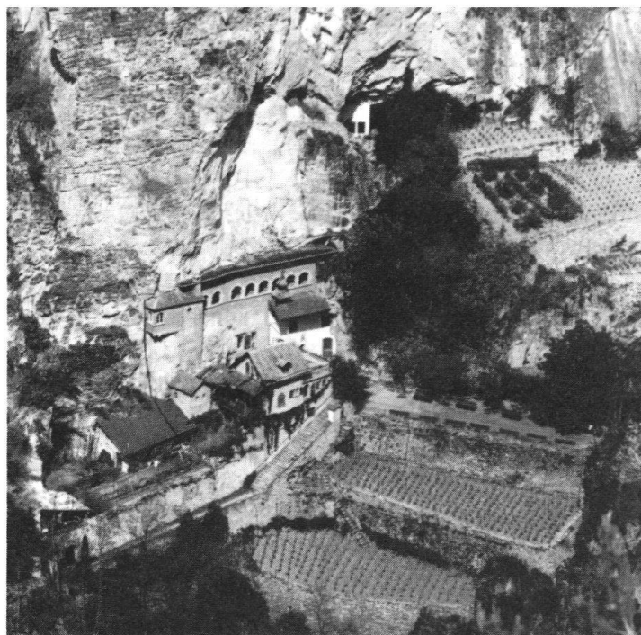
Le petit couvent situé dans les gorges de la Borgne. En bas, de gauche à droite: Témoignage d'art populaire primitif. Longeborgne, lieu de pèlerinage très fréquenté.

des ex-voto s'offre à nouveau aux regards des pèlerins. L'intention du fondateur, qui était d'attester devant ces derniers la constante reconnaissance de ceux qui avaient reçu des grâces, est ainsi pleinement respectée.