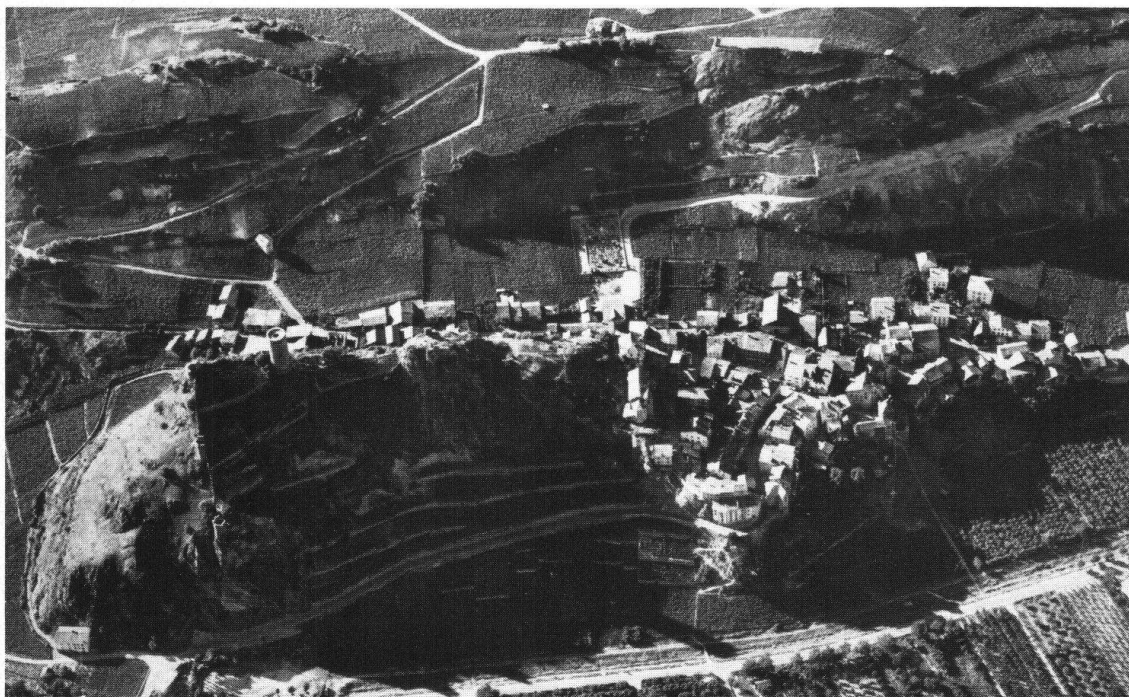
Saillon. Vue aérienne du bourg