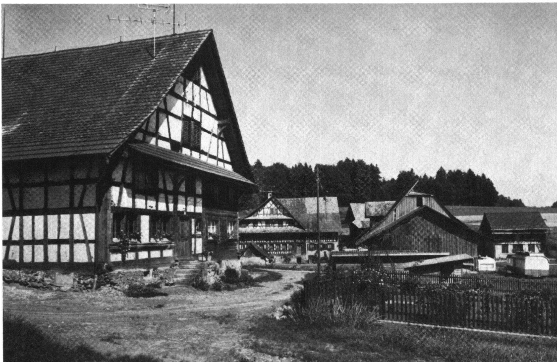
Mettmenstetten, Weissenbach. Hinten: Bauernwohnhaus, Mitte: ehemalige Mühle

Heimatkundeunterrichtes dienen. Ferner wird zusammen mit einer Lehrergruppe versucht, eine nach Einzelthemen gegliederte Sammlung von Dokumentationsblättern bereitzustellen, welche vom Lehrer z. B. in Arbeitsblätter umgearbeitet werden können.