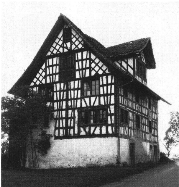
Schönenberg. Hinteregg. Bauernhaus Hitz (Ostansicht) nach der Restaurierung