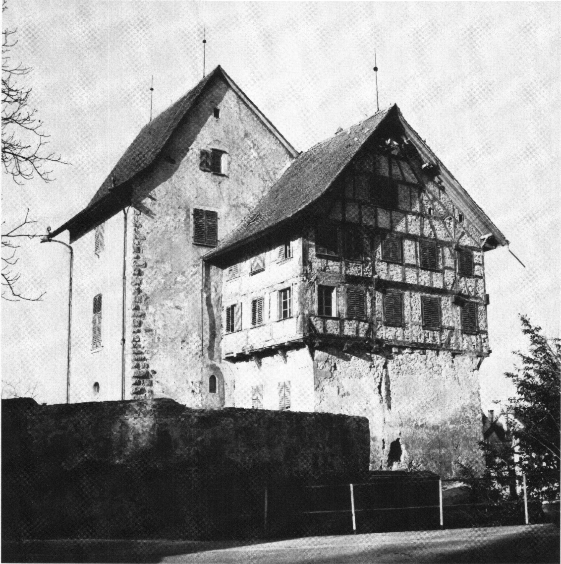
Zug. Die zu restaurierende Burg, die zum Museum ausgebaut wird