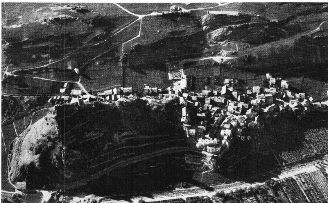
Saillon. Vue aérienne du bourg