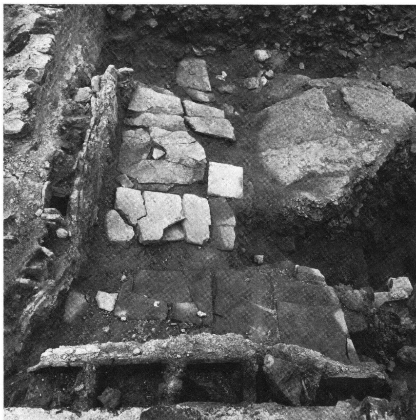
Martigny. Ville romaine Octodurus. Fouilles

Le programme relatif à Octodurus vise à éviter le massacre des vestiges antiques lors de constructions modernes, à mettre en valeur (sur place ou en musée) les plus belles trouvailles, à restaurer le « Vivier » (ruines de l'amphithéâtre), à recueillir le maximum de renseignements scientifiques et à intéresser le grand public. Ces buts doivent être atteints sans paralyser le développement de Martigny. Les rapports entre les besoins de la vie moderne et la sauvegarde des témoins d'un passé remarquable doivent être résolus ici de manière exemplaire.