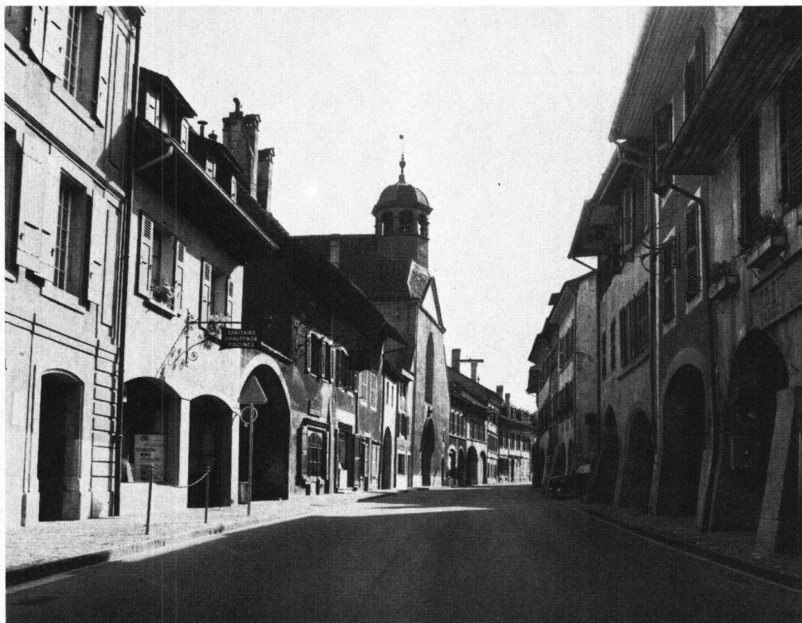
Coppet. Rue principale de la ville – menacée par le trafic routier

n'y veillent pas, leur commune risque de devenir une «cité-dortoir» de Genève. On sait à quel point l'équilibre entre l'habitat et toutes les autres activités est important.