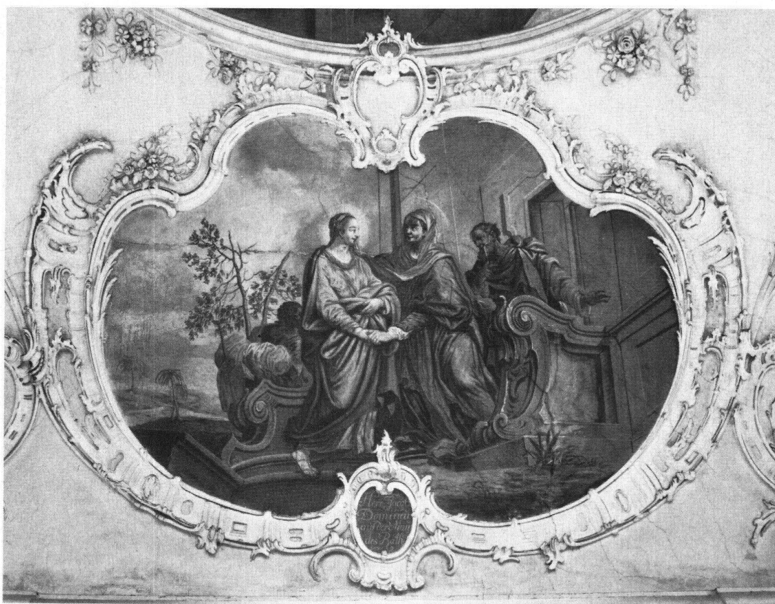
Seewen SZ. Marienkirche. Rokoko-Stukkaturen von Scharpf und Klotz (1772/1774) und Fresko von Josef Ignaz Weiss

Das Innere der Marienkirche in Seewen gehört zu den besten Zeugnissen barocker Raumkunst der Gegend von Schwyz . Die 1772–1774 entstandenen Stukkaturen sind gleichzeitig mit denjenigen in der Pfarrkirche Schwyz entstanden. Der kleine intime Raum der Marienkirche stellt in seinem Stuckdekor das unbeschwert Grazile des Rokokos weit mehr in den Vordergrund, als dies in der Pfarrkirche Schwyz möglich war. Mit bemerkenswerter Sicherheit und ausgewogenem Gefühl für Rhythmus umranken zarte, mit lieblichen Blumengirlanden durchsetzte Rocailen- und Palmettenmotive