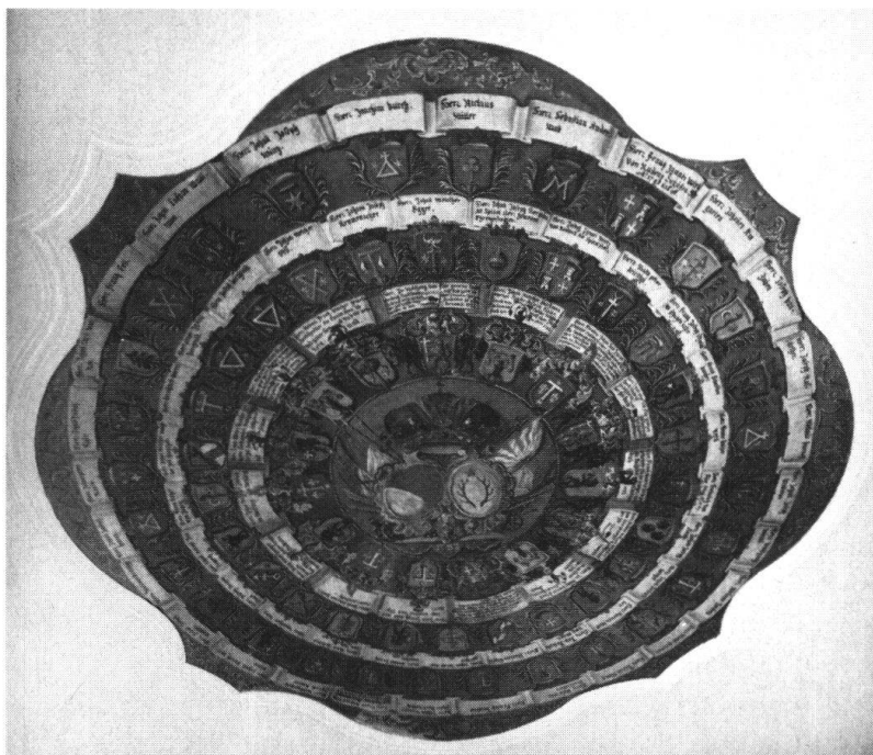
Sarnen. Schützenhaus auf dem Landenberg. Deckenmedaillon in der Schützenstube mit den Wappen der Landesbehörden und der Schützenmeister

Die für die nächsten Jahre vorgesehenen Restaurierungsarbeiten betreffen zwar in erster Linie diese beiden Bauwerke, doch sollen sie zugleich die Gesamtanlage erfassen, wobei besonders für den alten Landsgemeindeplatz und für das kleine Ausfallpförtchen, das als letzter Zeuge der einstigen Burg erhalten geblieben ist, konservierende Massnahmen vorgesehen sind. Als vordringlichste Aufgabe gilt die Instandstellung des Schützenhauses , das 1752 von Landammann Just Ignaz Imfeld nach eigenem Plan erbaut wurde. Seine charakteristische Silhouette mit dem eleganten, seitlich geschweiften Giebel und den zwei flankierenden Zwiebeltürmchen ist zum eigentlichen Wahrzeichen von Sarnen geworden. Im Obergeschoss des Mittelbaues befindet sich der geräumige Schützenaal, dessen Stuckdecke in einem grossen Mittelmedaillon die Wappen der damaligen Landesbehörden, der vorsitzenden Herren und des gesamten Landrates zeigt, während in den vier kleinen Eckkartuschen Szenen aus der frühen Obwaldner Geschichte dargestellt sind. Die bis in die neuere Zeit fortgeführten Wappen der Schützenmeister bilden einen dekorativen Wandfries. Zu Beginn der 1920er Jahre wurde das Schützenhaus seinem Zweck entfremdet. Es diente als Kleidermagazin der Militärver-