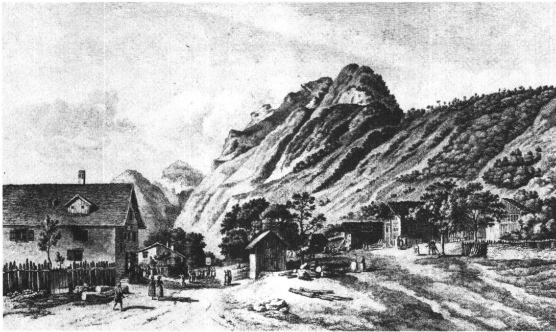
Näfels. Fahrtsplatz. Stich von H. L. Schmutz, 1779. Hinten das «Rössli», in der Mitte des Platzes das zu restaurierende Haus in seiner ursprünglichen Form