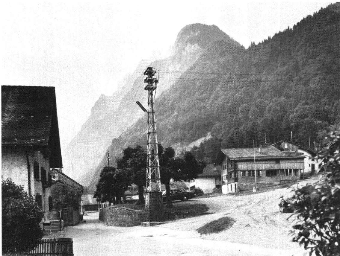
Näfels. Fahrtsplatz. Heutiger Zustand, der nach der alten Vorlage saniert werden soll; der hässliche Elektromast soll verschwinden