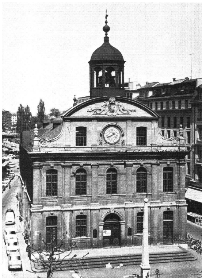
Genève. Temple de la Fusterie de Jean Vennes, 1714. Avant la restauration

Département des travaux publics, Commission des monuments et des sites