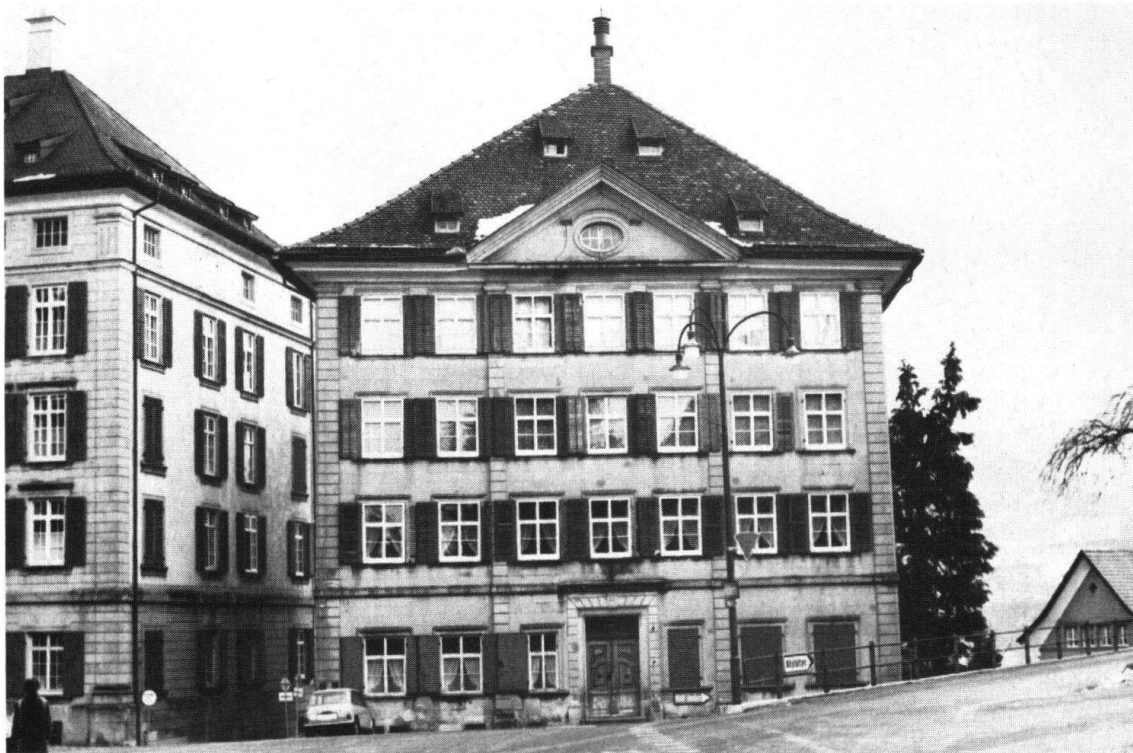
Trogen. Pfarr- und Gemeindehaus. Nordfassade

Die Restaurierung dieses bedeutenden Gebäudes als «Réalisation exemplaire» des Kantons wird dessen kunstgeschichtlich-kulturpolitischen Stellenwert gebührend ins öffentliche Bewusstsein heben.