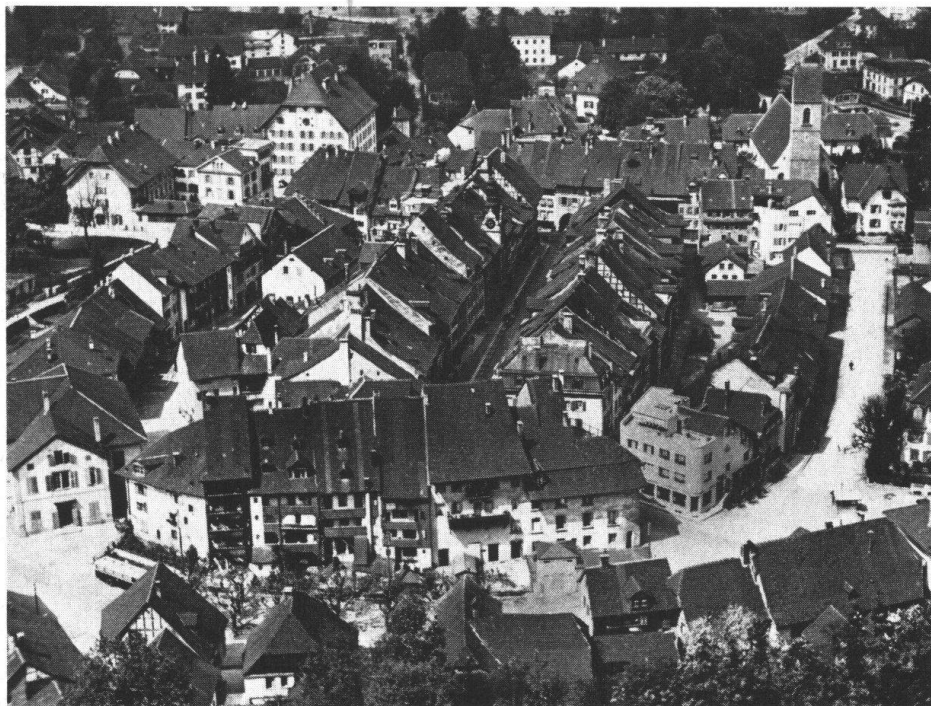
Die Stadt Lenzburg vom Schlossberg aus