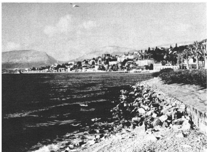
Von oben nach unten: Eine der prächtigen Alleen von Colombier wird durch den Bau der Autobahn kupiert. – Längs dieser zum Teil aufzufüllenden Seebucht gedachten die Neuenburger Stadtbehörden die N 5 zu verlegen.

und den kleinen Hafen nach aussen verlegen. Dessen ungeachtet hat sich an dieser Stelle eine archäologische Tragödie ergeben. Zugegeben, der archäologische Dienst, der im Hinblick auf den Autobahnbau geschaffen worden ist, hat aufmerksam die Arbeiten verfolgt und die sich aufdrängenden Untersuchungen und Ausgrabungen mit Hilfe der staatlichen und weiterer Mittel pflichteifrig durchgeführt. Indessen war die zur Verfügung stehende Zeit ausserordentlich knapp. Man rettete, was möglich war, von den Funden zweier Pfahlbauersiedlungen, die, wie man vernimmt, die reichsten der ganzen Schweiz sein sollen. Es handelt sich um Siedlungen einerseits des ausgehenden Neolithikums (3. Jahrtausend vor Chr.), andererseits der Endphase der Bronzezeit (ca. 800 vor Chr.). Die überaus wertvollen Aufdeckungen werden zu 95 % verloren sein, denn, so stellte