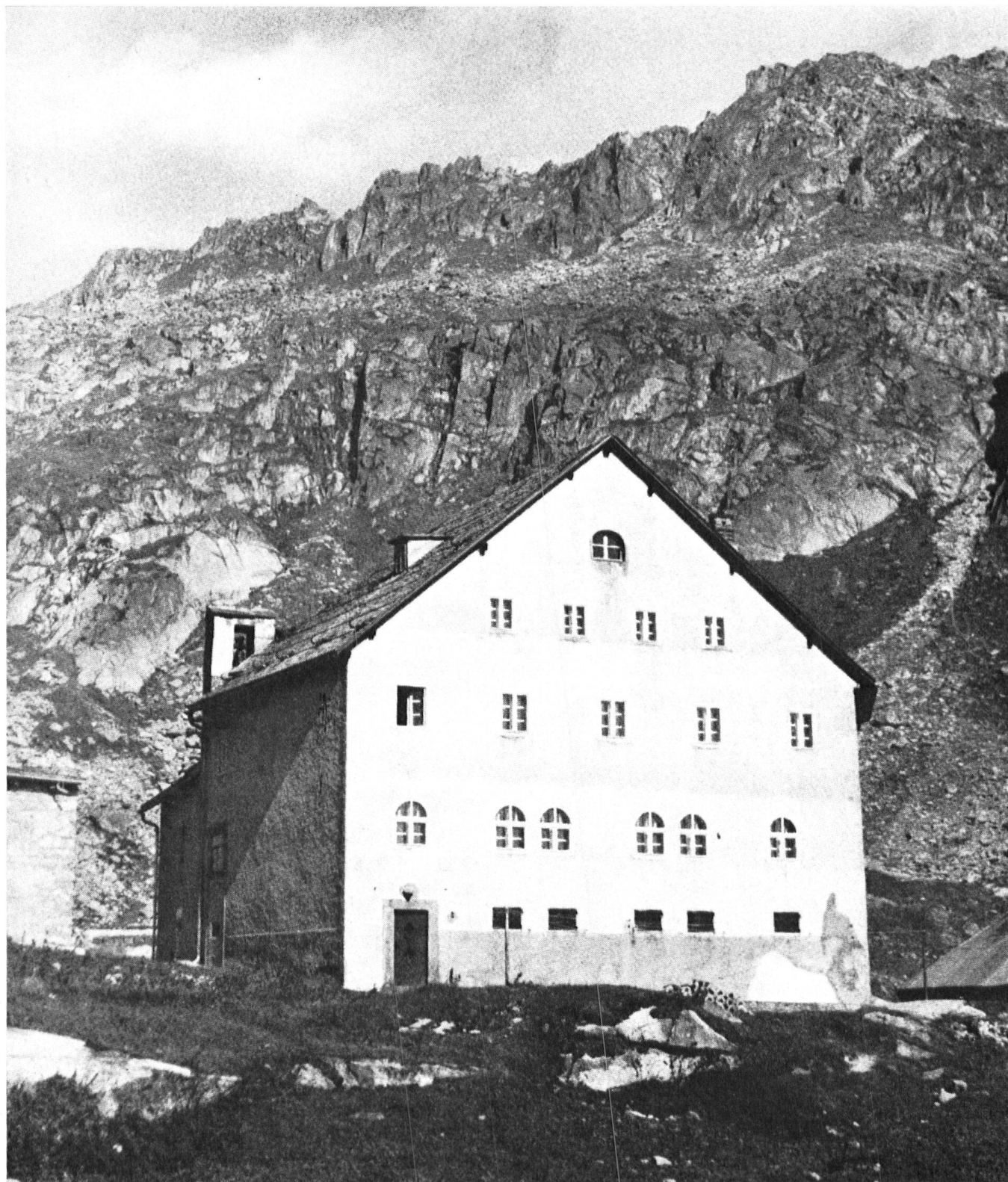
L'ancien hospice (tel qu'il se présente aujourd'hui).