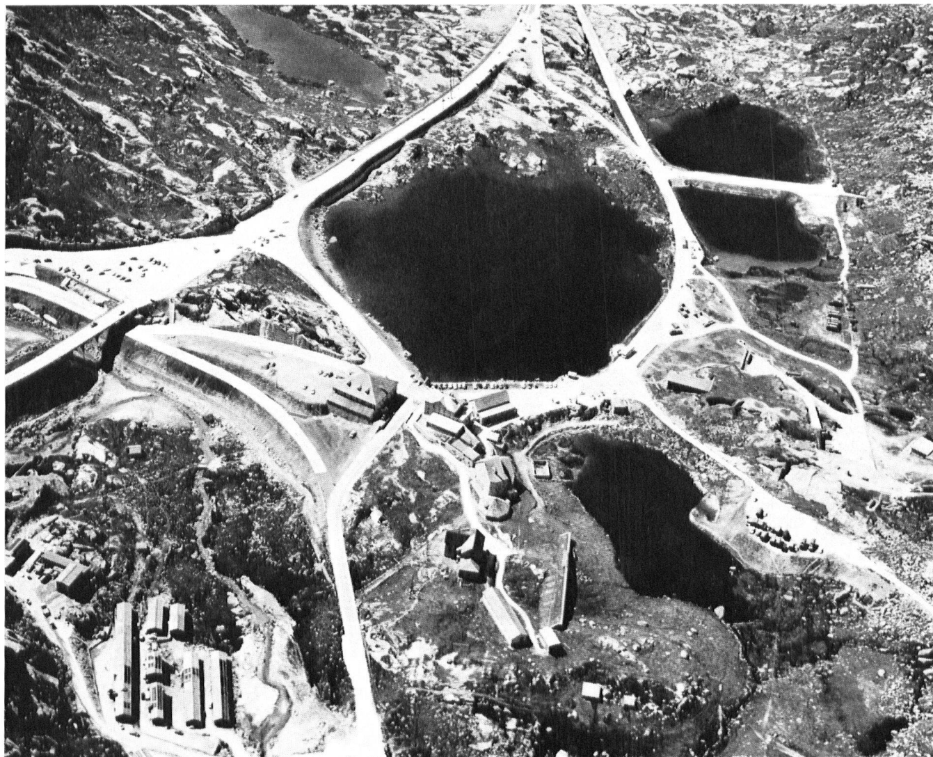
Vue aérienne du réseau routier tel qu'il est aujourd'hui. A gauche, la route moderne qui évite la gorge de Tremola; l'ancienne route, sur l'autre rive du lac, continue vers le sud (au milieu de la photo).

Une avalanche ayant fait des dommages en 1777, on ne se contenta pas de reconstruire hospice et chapelle, on les reconstruisit en les agrandissant. Une gravure de J. B. Bullinger représente l'hospice, derrière lequel on aperçoit le clocher en forme d'oignon de la chapelle, et deux bâtiments vastes et presque sans fenêtres, sans doute remises et écuries pour des bêtes de somme. Dans l'hiver 1799 les combats entre l'armée française d'une part, les Russes et les Autrichiens de l'autre, firent de graves dégâts aux bâtiments.