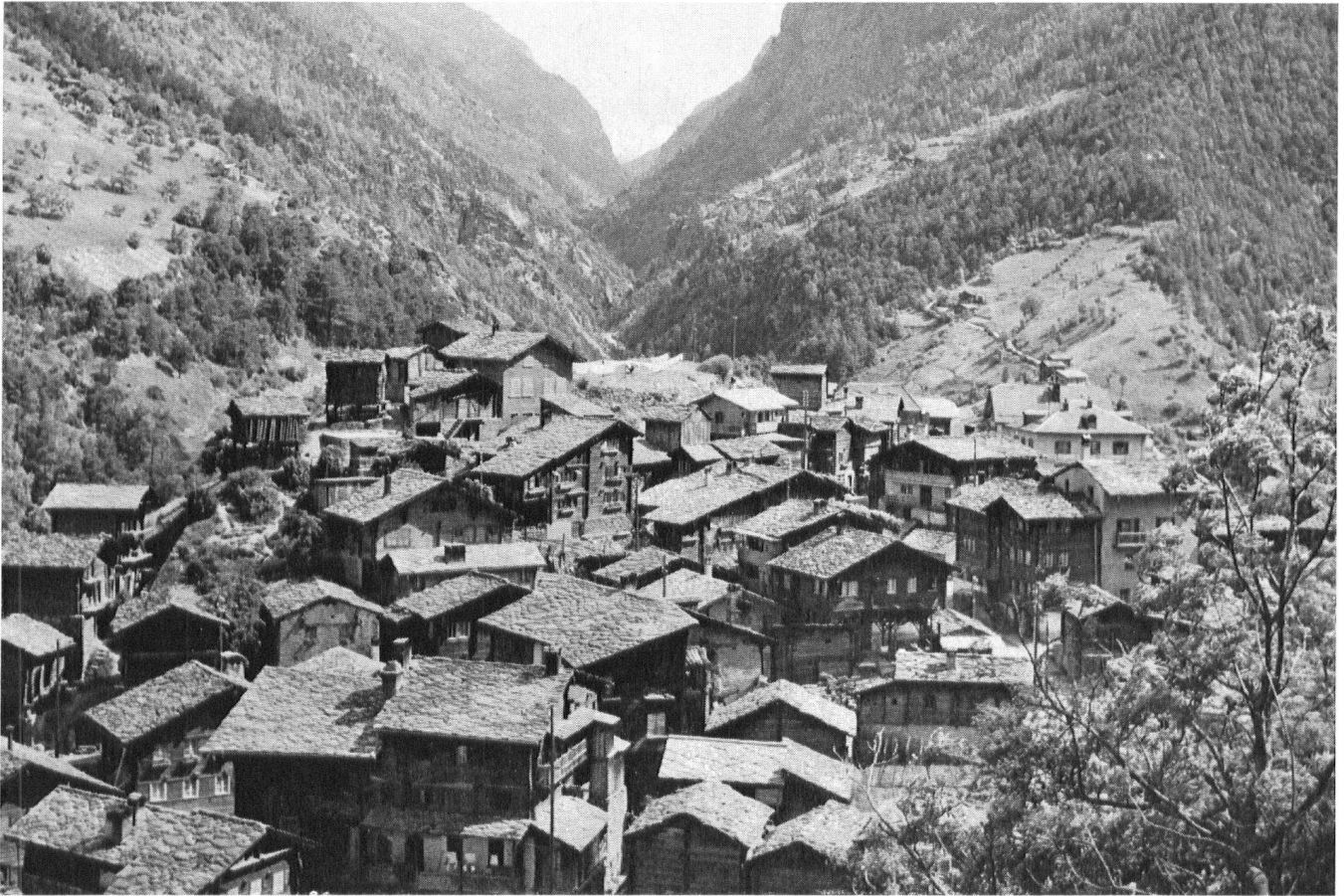
Valais. Village cohérent; réglé avant l'ère de la préfabrication des éléments—types des fenêtres, des toitures et des façades de bois.

Dans deux villages valaisans les curieux affluent pour contempler les jeux immodestes, puérils et inarticulés des entassements de béton des églises nouvelles où, par des concessions douteuses au pseudo-modernisme, les gardiens de la vie spirituelle croient pouvoir maintenir leur primauté.