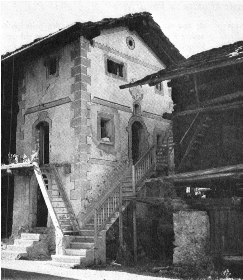
Valais. Maison peinte, objet méritant l'attention de la Ligue suisse. Contraste avec les maisons en bois, mais adaptation par le maintien de l'inclinaison des toits.

tent les cotisations, les subsides fédéraux et privés. En contact avec les autorités, elle adresse à celles-ci des rapports et des requêtes, et inversement, elle offre sa collaboration lorsqu'on la lui demande. Elle s'adresse également aux propriétaires privés.