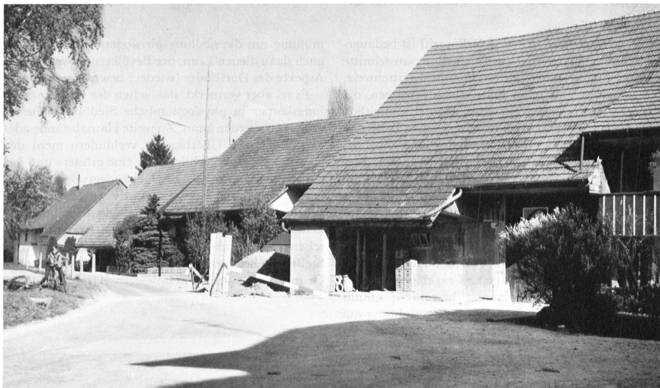
Niederbuchsiten SO, Kleinbauernhäuser an der Wolfwilerstrasse [unten] – Im Vergleich mit den Bauernhäusern im Dorfkern (oben) fallen bei diesen Bauten am Dorfrand die gedrungeneren Grundrisse und der grosse Dachanteil auf. Das Charakteristikum dieser baulichen Einheit liegt auch nicht in der gemeinsamen Trauf- linie, sondern in einer eigentümlichen Staffelung der Häuser.