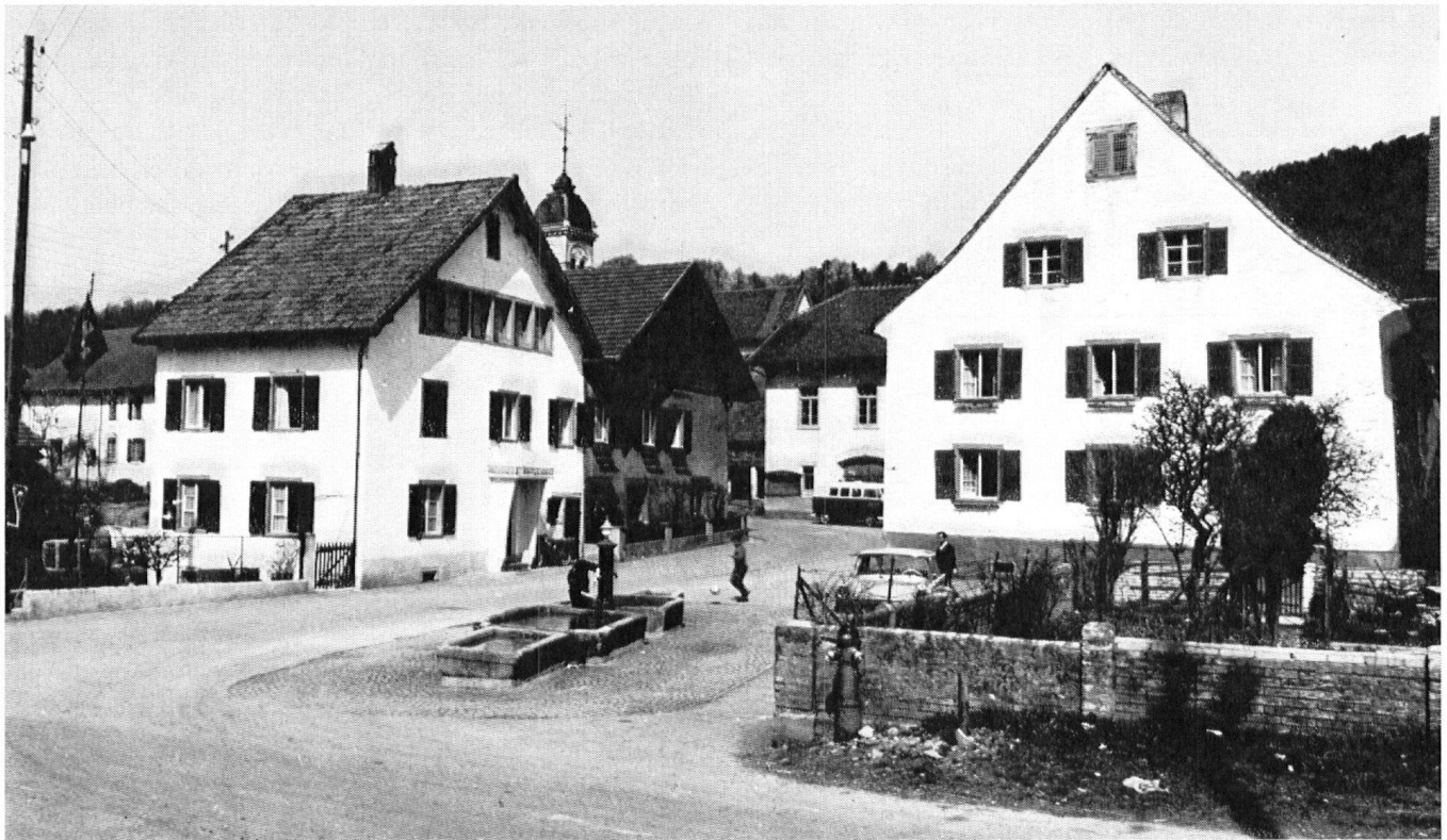
Movelier BE, Dorfkern – Blick vom Gasthof auf den zentralen Dorfplatz. Die ungewöhnlich hohen, fensterreichen Giebelfassaden und das Gemeindehaus (Bildmitte, teilweise verdeckt) machen den besonderen Charakter dieser den Platz bildenden Baugruppe aus.

Schon die Veränderung der Proportionen an einem der an sich nicht wertvollen Häuser durch Erweiterung, Aufstocken oder ähnliche Massnahmen müsste das Erscheinungsbild des Ganzen empfindlich stören, möglicherweise stärker als ein geschickt eingefügter Neubau.