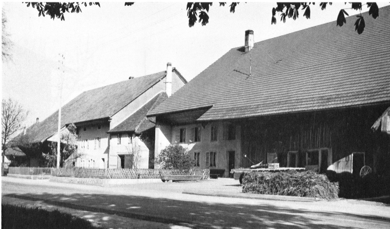
Niederbuchsiten SO, Bauernhäuser an der Dorfasse [oben] – Die traufständigen Bauten wenden der Strasse stattliche, am Wohnstock über mindestens zwei Geschosse laufende Fassaden zu. Die lockere Doppelreihe behäbiger Bauernhäuser unter stolzen Satteldächern entspricht in ihrer Grosszügigkeit der geschichtlichen Stellung des Ortes als Heimat des Bauernführers Adam Zeltner.