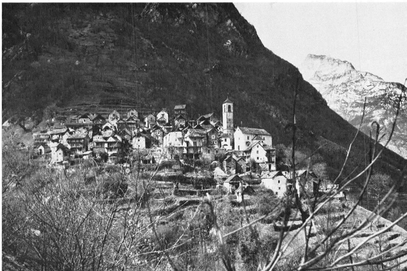
Corippo, dans le val Verzasca, l'un des villages tessinois les plus caractéristiques. Des études sont en cours pour assurer et son intégrité et sa survie.