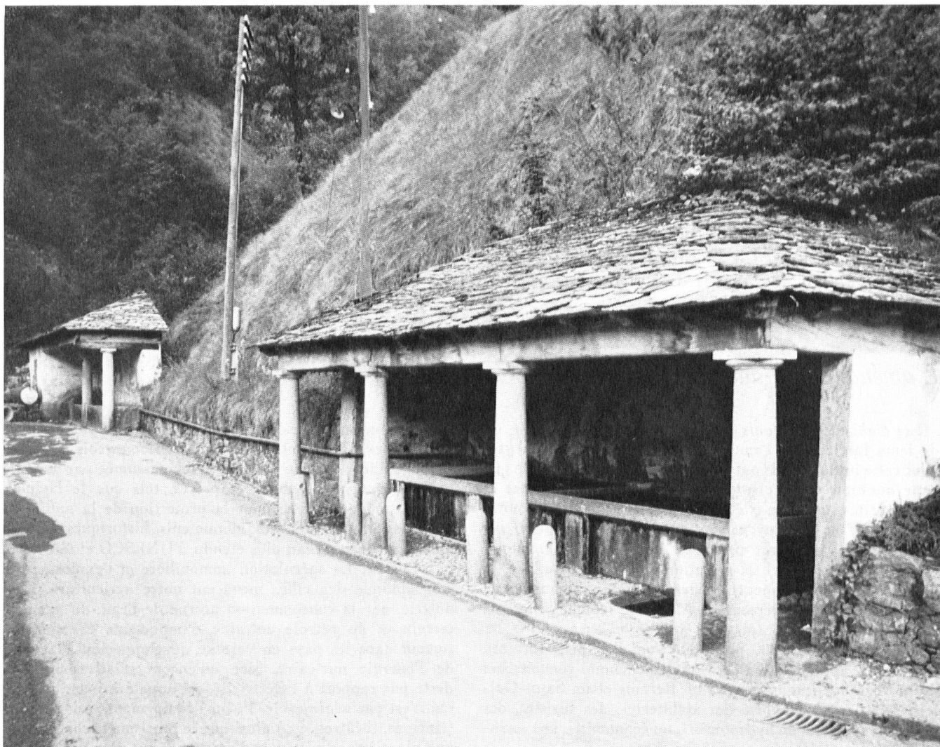
Au fond du val Muggio, dans le Mendrisiotto, deux fontaines, la première où se lave le linge, la seconde abreuvoir. Grâce à la construction prochaine d'une route de contournement, ces jolies fontaines seront mieux mises en valeur.

Monte-Generoso: Lorsque la S. A. Bellavista eut présenté un projet de nouveau centre touristique, l'Etat nomma une commission spéciale pour l'élaboration d'un plan de zonage dans les communes intéressées. Une commission de notre section va l'étudier et proposera en tout cas des modifications si un lotissement acceptable et harmonieux, avec des zones de non-bâtir correspondantes, n'est pas assuré.