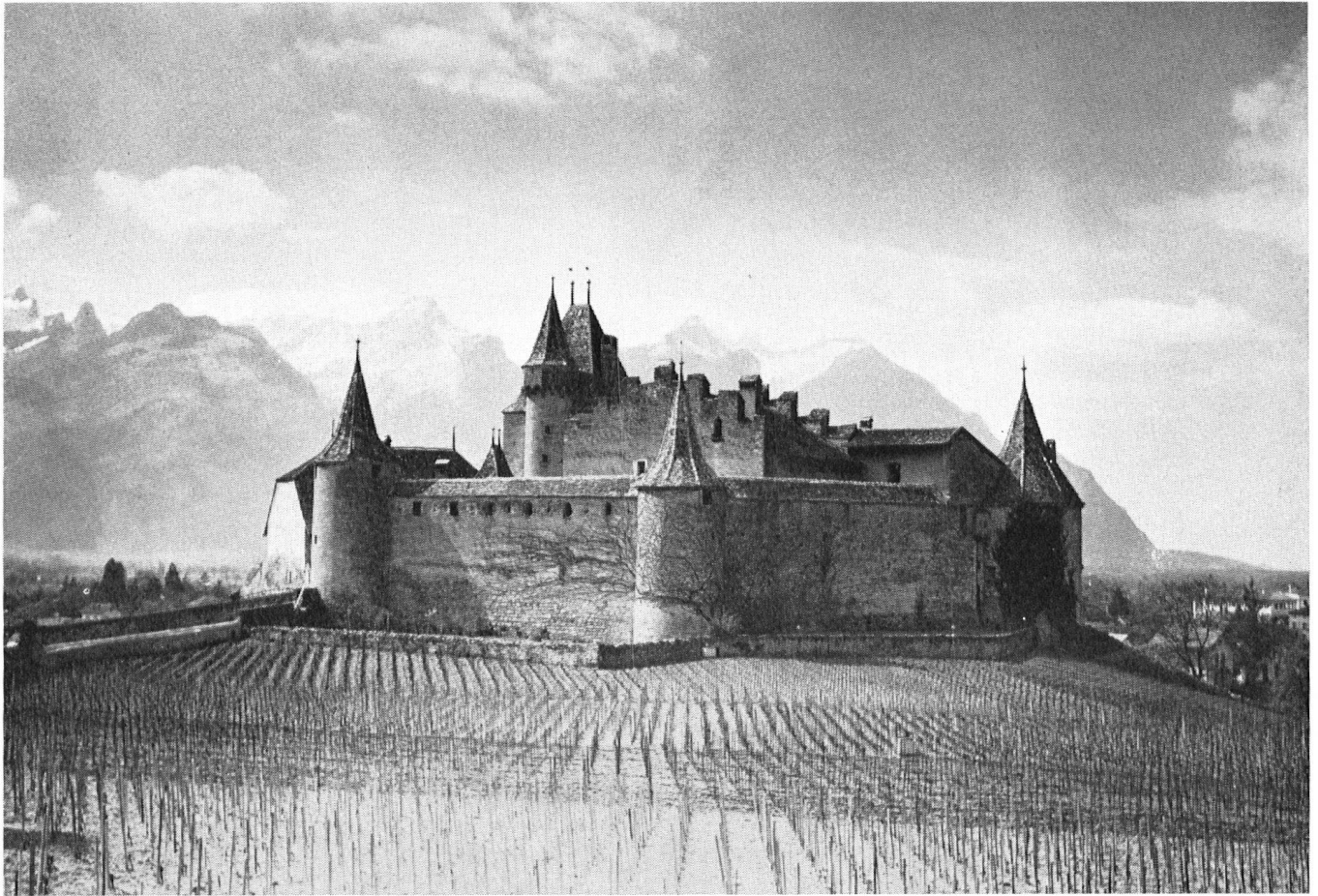
Aigle. L'un des plus beaux châteaux médiévaux du canton de Vaud. Figure naturellement dans les monuments classés. A servi de prison. Quelle sera sa destinée quand il aura été restauré?

d'arbres, et de végétation, le cours naturel des rivières, les rives des lacs, les marais et les roselières. L'abandon de matériaux et de déchets de toute nature est prohibé. L'usage des produits chimiques, engrais, insecticides, etc., est soumis à contrôle et restriction.