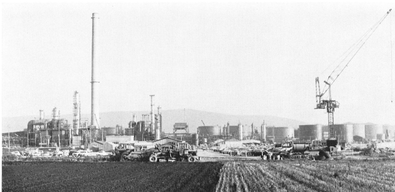
La raffinerie de Cressier sur sol neuchâtelois est une création certes imposante. Pour le paysage du Seeland une cruelle et inguérissable blessure.

de plaisance, ce qui signifie, si chaque bateau a deux occupants, que 20 000 navigateurs, dont certains habitent jusqu'à Bâle et jusqu'à Genève, viennent passer leurs soirées ou leurs fins de semaine dans ces lieux), d'autre part, en monuments d'art, en sites archéologiques, en réserves naturelles aussi. La vocation de délasserment est manifeste. – Or, là aussi, on voit poindre les indices d'un échec. Les trois cantons, saisis par la fièvre de l'expansion, ont jeté leur regard sur le Seeland. Neuchâtel est à l'avant-garde, avec la construction d'une raffinerie, d'une fabrique de ciment et d'une usine thermique. Des nuages de fumée se promènent dans le ciel, emblèmes du progrès. Du côté fribourgeois, c'est la silhouette de Morat qui,