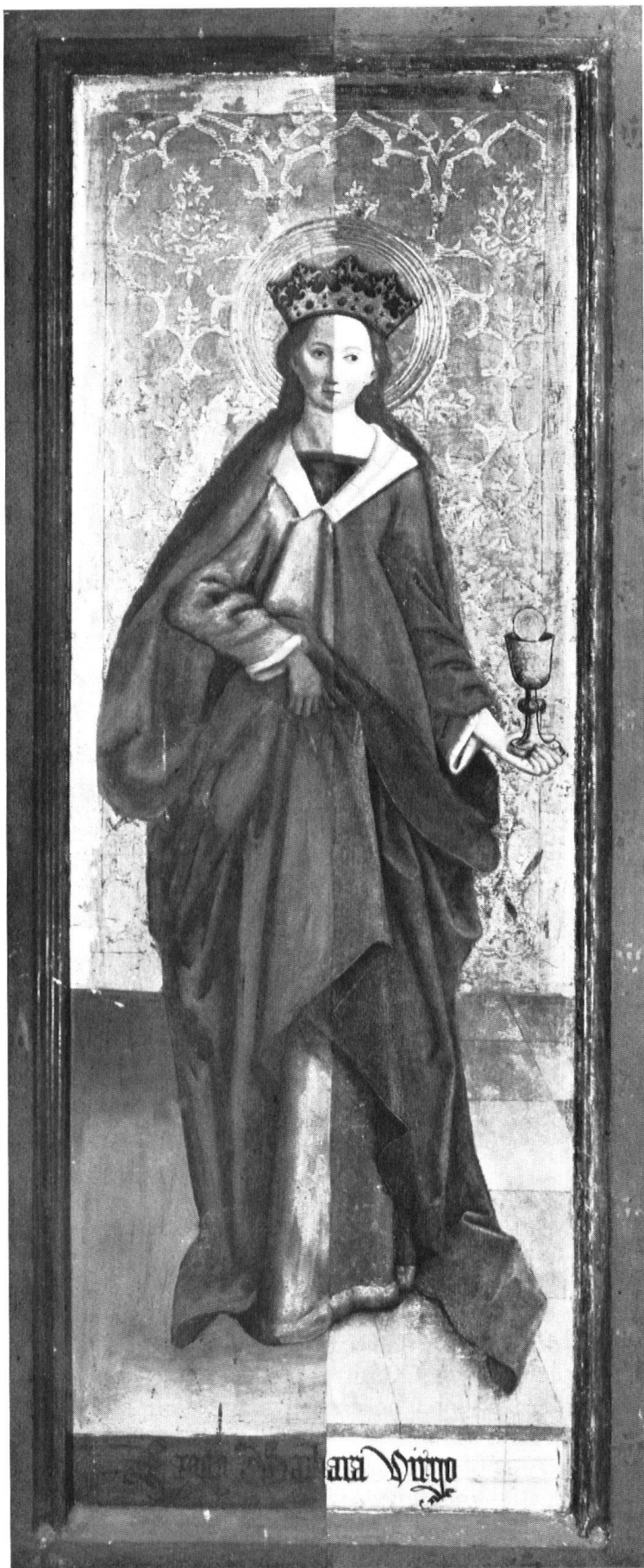
Sur le volet de droite (lui aussi partiellement restauré), sainte Barbara, tenant de la main gauche la coupe du martyr.