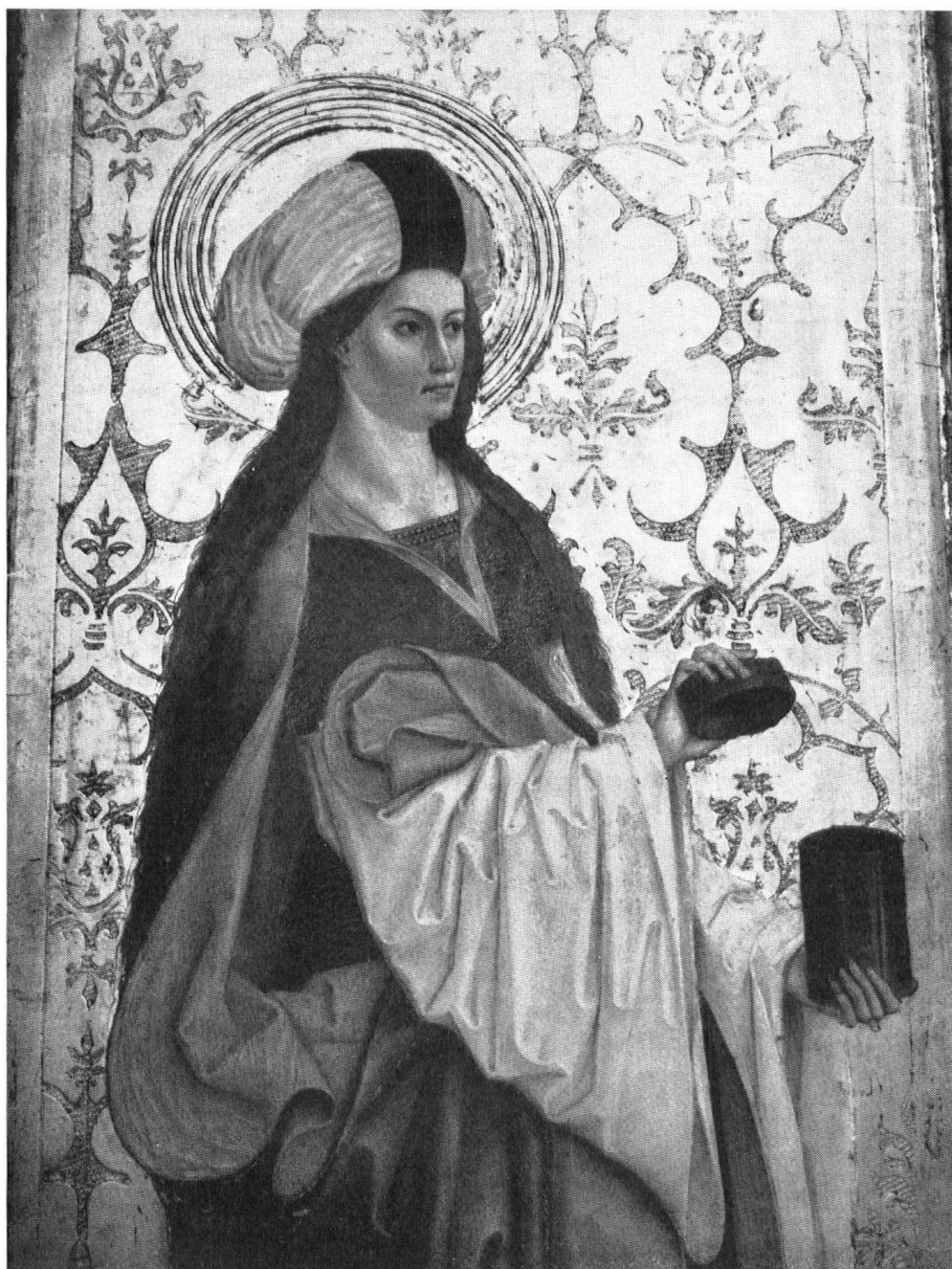
Marie Madeleine (fragment du volet de gauche). Chef-d'œuvre qui, comme les autres peintures, date de 1490 environ.

Marie-Madeleine, à Lumbrein, un autel qui montrera ce dont est capable la technique moderne de restauration artistique.