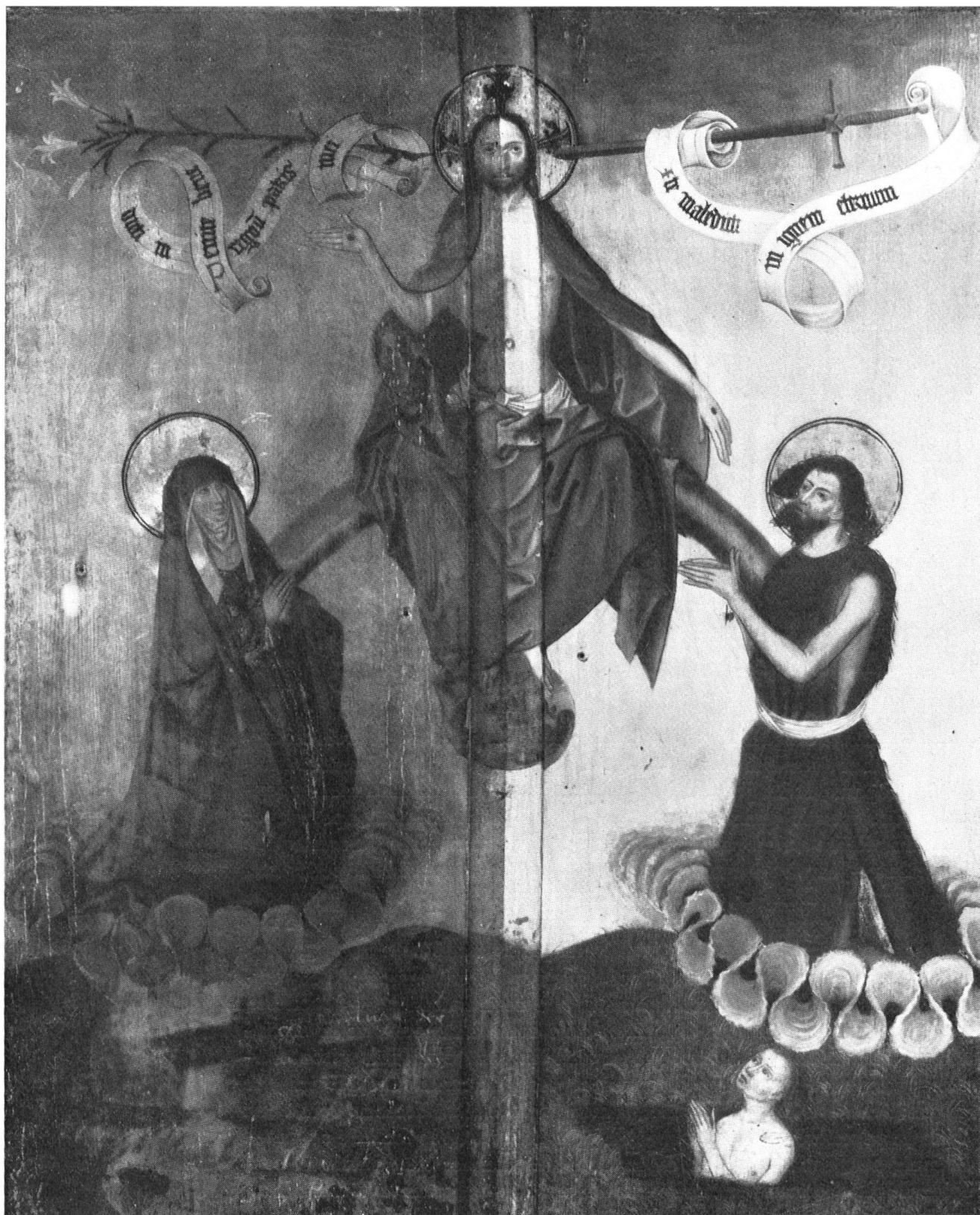
La composition principale, plaquée contre le mur, est restée inaperçue jusqu'à une date récente. Transportée à Zurich, cette œuvre saisissante fait l'objet des soins de l'Institut suisse pour l'étude de l'art. Notre photo a été prise alors que seule la moitié de droite avait été remise en état.