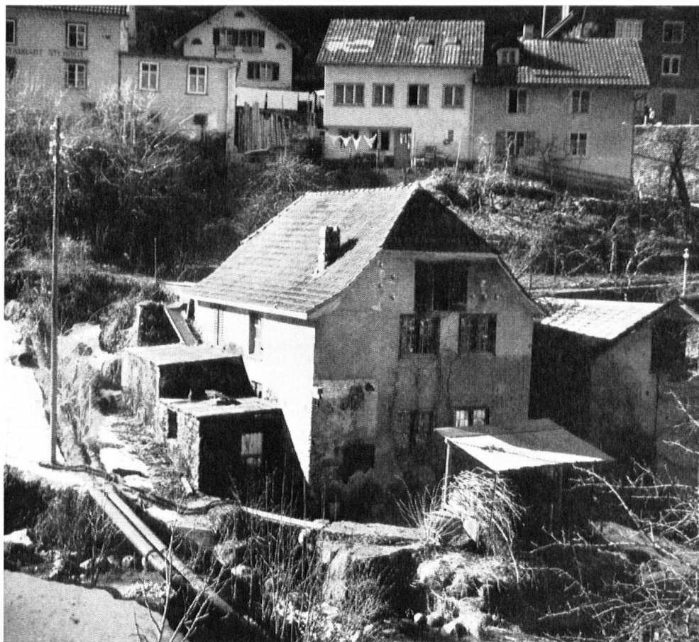
Telle était la forge... Restauration exécutée avec l'aide de la section glaronaise et de la Ligue suisse.