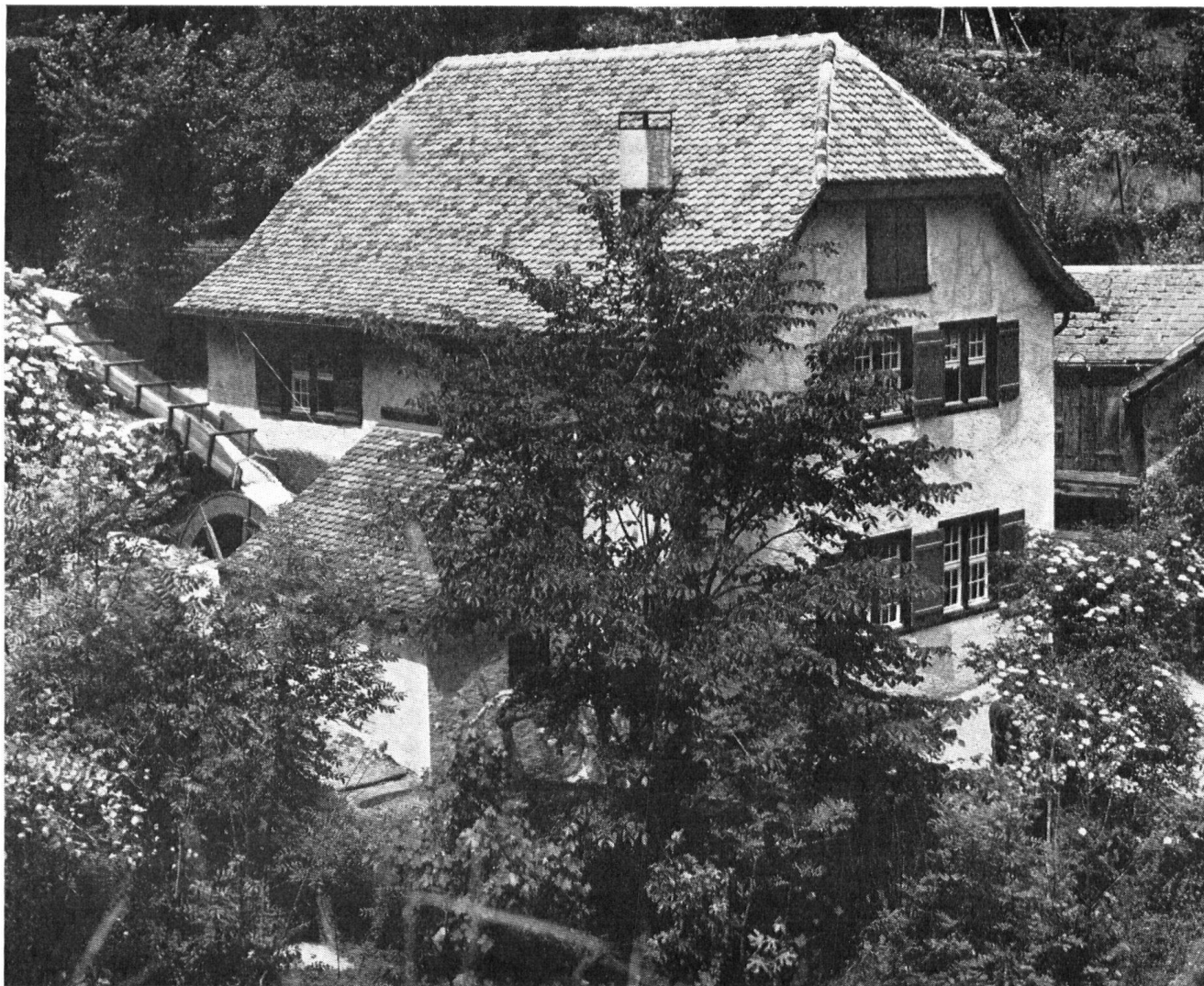
La forge de Mühlehorn GL, témoin impressionnant du travail artisanal de jadis, après la restauration. A gauche la conduite qui amène l'eau à la roue.