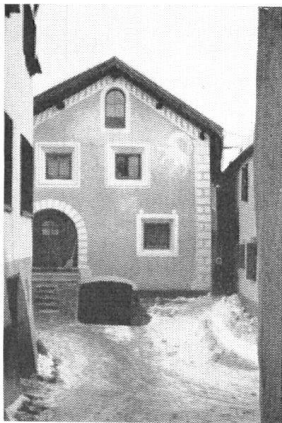
Das Bild auf der gegenüberliegenden Seite zeigt ein vor kurzem niedergelassenes Haus in Zuoz, das hinsichtlich der Einteilung seiner Geschoße einen recht seltenen Bautyp verkörperte. Die Lücke im Dorfbild ist nicht geschlossen, sondern nur dadurch einigermaßen verbessert worden, als das dahinter sich befindende Wohnhaus seine Fassade aufgefrischt und mit Sgraffiti verziert erhielt (kleines Bild oben).

Idiom anbelangt, allerdings nur in der nördlichsten Ecke am Rhein – und vier Strömen tributäre Flußgebiete erstreckte wie der heutige Kanton. Reich ausgeprägt ist denn sein Landschaftscharakter; Bevölkerung, Siedlung, Wirtschaft wandeln sich mit der Höhenlage und Exposition, den klimatischen Verhältnissen, der Vegetation. In seiner Geschichte aber, in manchen Bauten auch als noch aufrechten Zeugen der Vergangenheit, spiegelt sich die Bedeutung des Transitverkehrs, der einst über und schräg durch das Gebirge Süddeutschland mit Italien verknüpfte. So erscheint uns dieser gute Drittel Graubündens als gegebene Einheit, um, was am Beispiel des ganzen Kantons hier zu weit führen würde, ein spezielles, just in Rätien genauer untersuchtes Problem vor unseren Lesern auszubreiten.