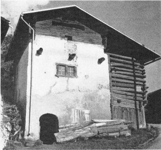
Links: Haus mit zwei- raumtiefem Wohngeschoß zu Scharans im Dom- leschg. Es steht heute leer und ist verwahrlost.