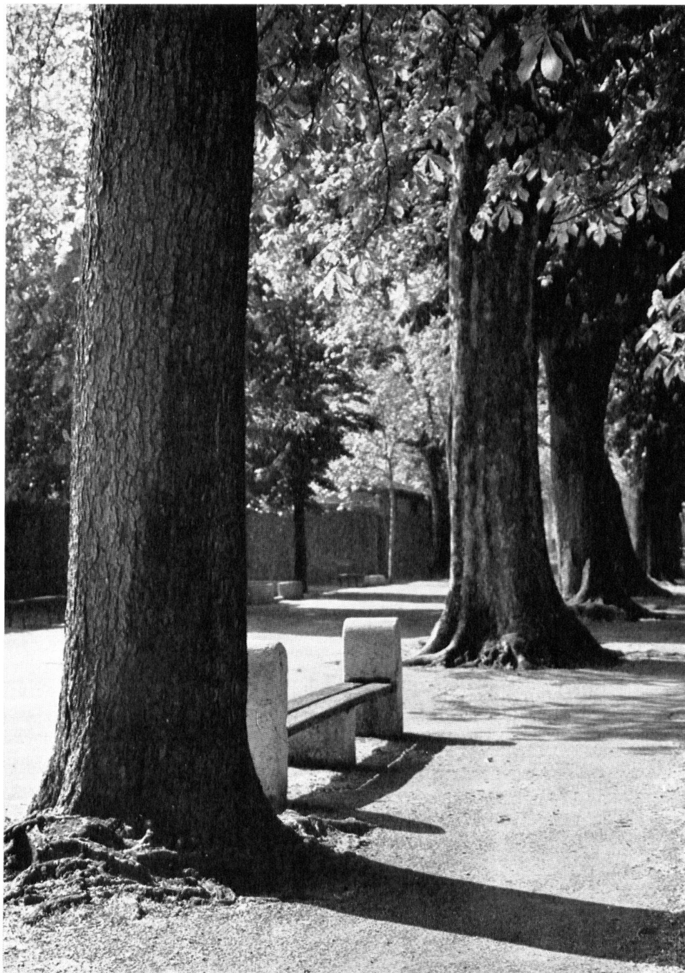
« Les Promenades ». Le long du canal récemment supprimé qui servait d'enceinte à Carouge du côté de l'ouest et du nord, on planta des peupliers en 1784. Ils furent abattus sous l'Empire, lors d'un hiver rigoureux. Les remplacèrent deux rangs de platanes et de marronniers qui, superbes, subsistent.

banque sur la place de la Collégiale de Bellinzzone (encadrée de maisons patriciennes baroques) nous incite à la prudence.