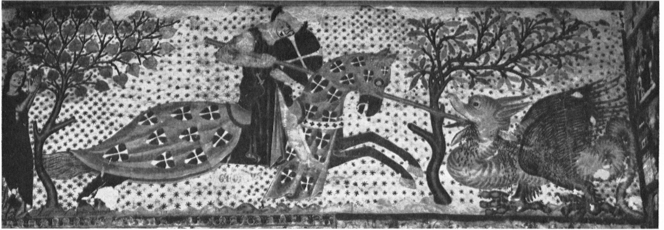
Kapelle Rhäzüns: St. Georg im Kampf gegen den Drachen (um 1340).

täler brachten, daß Wasserzinsen und Steuern den verarmten Gemeinden neue große Einnahmen verschafften, daß neue, bessere Zufahrtsstraßen entstanden und daß so der seit Jahrzehnten anhaltenden allmählichen Entvölkerung wirksam der Riegel geschoben wurde. Das ist auch Heimatschutz! Endlich ist die Stromproduktion dieser Werkgruppe mit 1\frac{1}{3} Milliarden Kilowattstunden im Jahr, von denen \frac{4}{5} der Schweiz zugute kommen, wirtschaftlich von größter Bedeutung für unser Land.