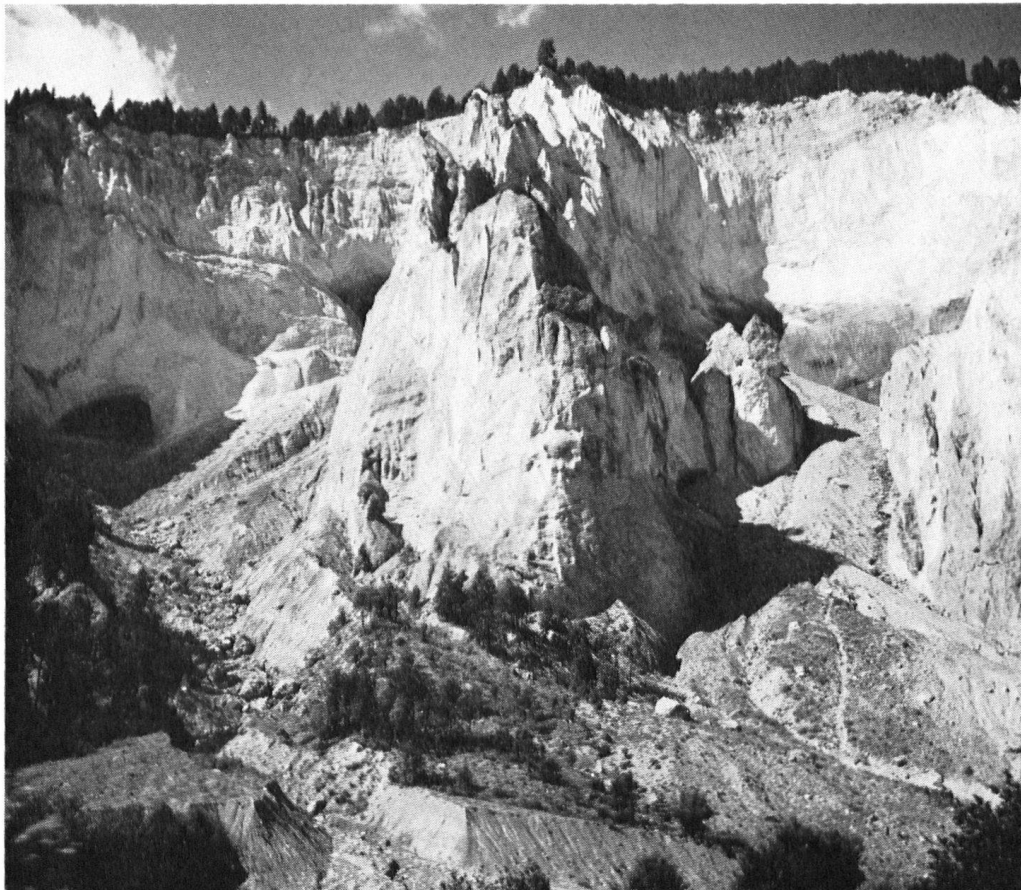
Manchem Teilnehmer am Jahresbott mag das Herz leise gebebt haben bei der Fahrt durch die abenteuerliche Schlucht, die der Rhein durch den prähistorischen Bergsturz von Flims gefressen hat.

Frage befassen müssen, ob nun dieser Bauernhof zweifelwürdig sei oder nicht. (Unser Glarner Obmann wird mir dieses kleine Wortspiel sicher nicht verübeln!) Doch nun zu ernsteren Dingen: