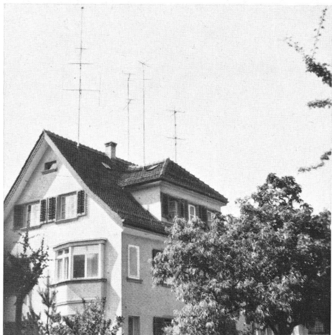
Links: Wie es landauf, landab auszusehen beginnt. In dem scheinbaren ‚Ein- familienhaus‘ wohnen offenbar vier Mieter, von denen jeder seinen eige- nen ‚Christbaum‘ auf dem Dach haben wollte.