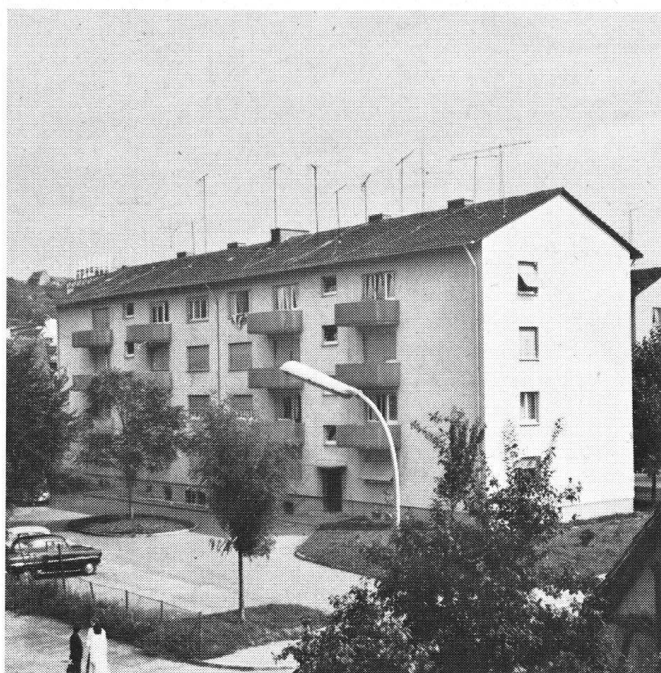
Rechts: Mietblock mit einstweilen 10 Antennen. Bei der nächsten ‚Teuerungszu- lage‘ werden bestimmt noch einige weitere dazu- kommen; dabei würde eine Gemeinschafts- antenne nur einen Teil davon kosten.

d. h. die Anzahl der Elemente jeder einzelnen Antenne, wird wiederum durch die örtlichen Empfangsbedingungen und die evtl. zu eliminierenden Reflexionen bestimmt. Alle diese Anforderungen haben zu dem immer unerträglicher werdenden Antennenchaos auf unsern Hausdächern geführt, und der Unwille, der dagegen laut wird, ist verständlich.