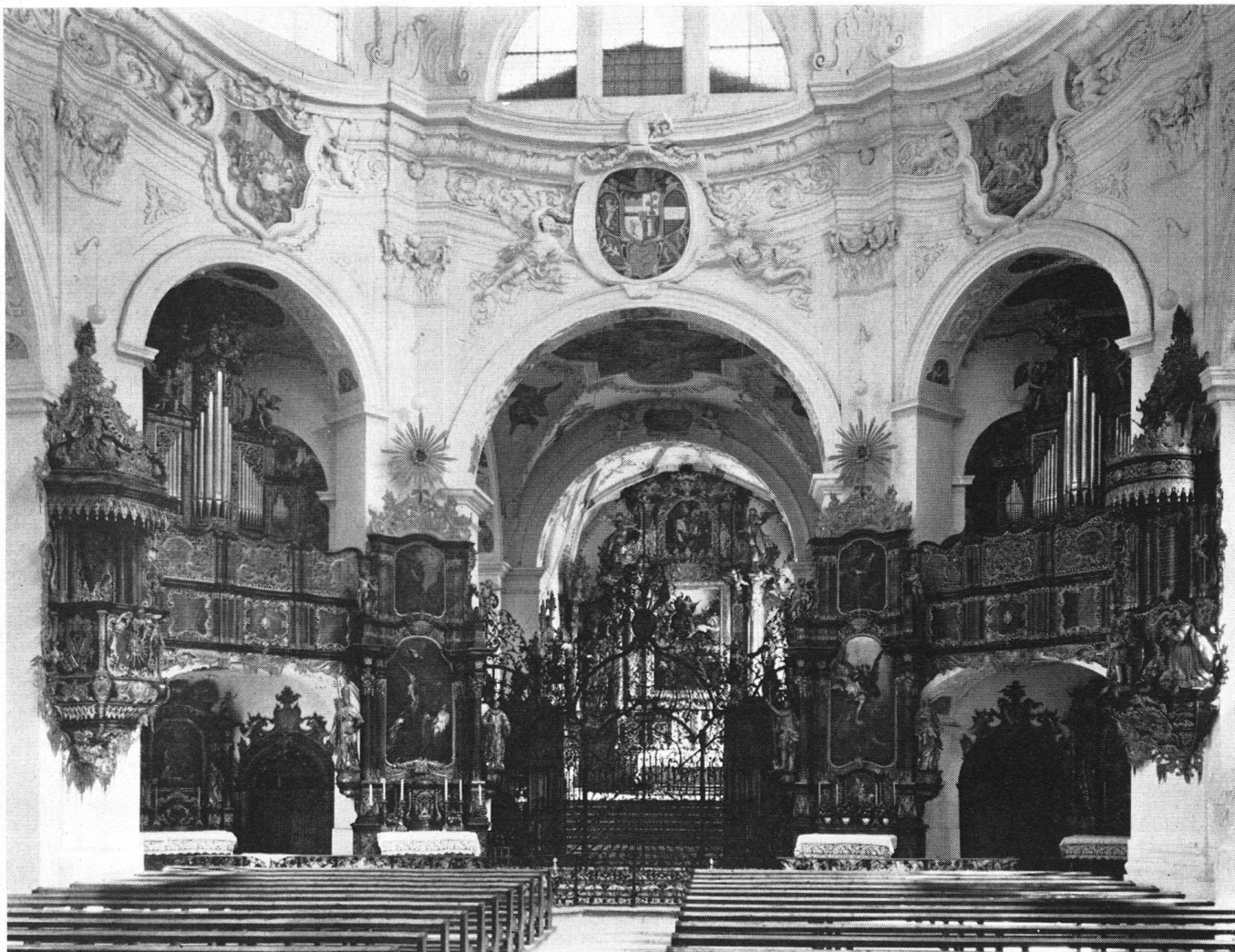
Eglise abbatiale; intérieur, sous la coupole octogonale, exécutée d'après les plans de P. Gaspard Moosbrugger (1694).