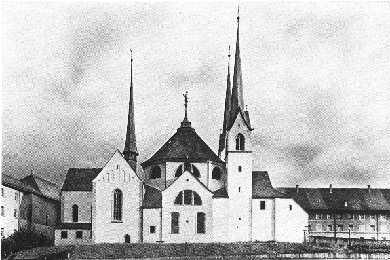
Eglise de l'ancienne abbaye bénédictine de Muri en Argovie, appartenant aujourd'hui à la paroisse catholique romaine. Vue prise du nord. — En bas: L'écran que constituerait le bâtiment projeté par la commune.