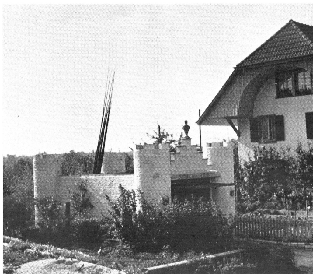
En terre bernoise, castel en miniature pour loger une auto.