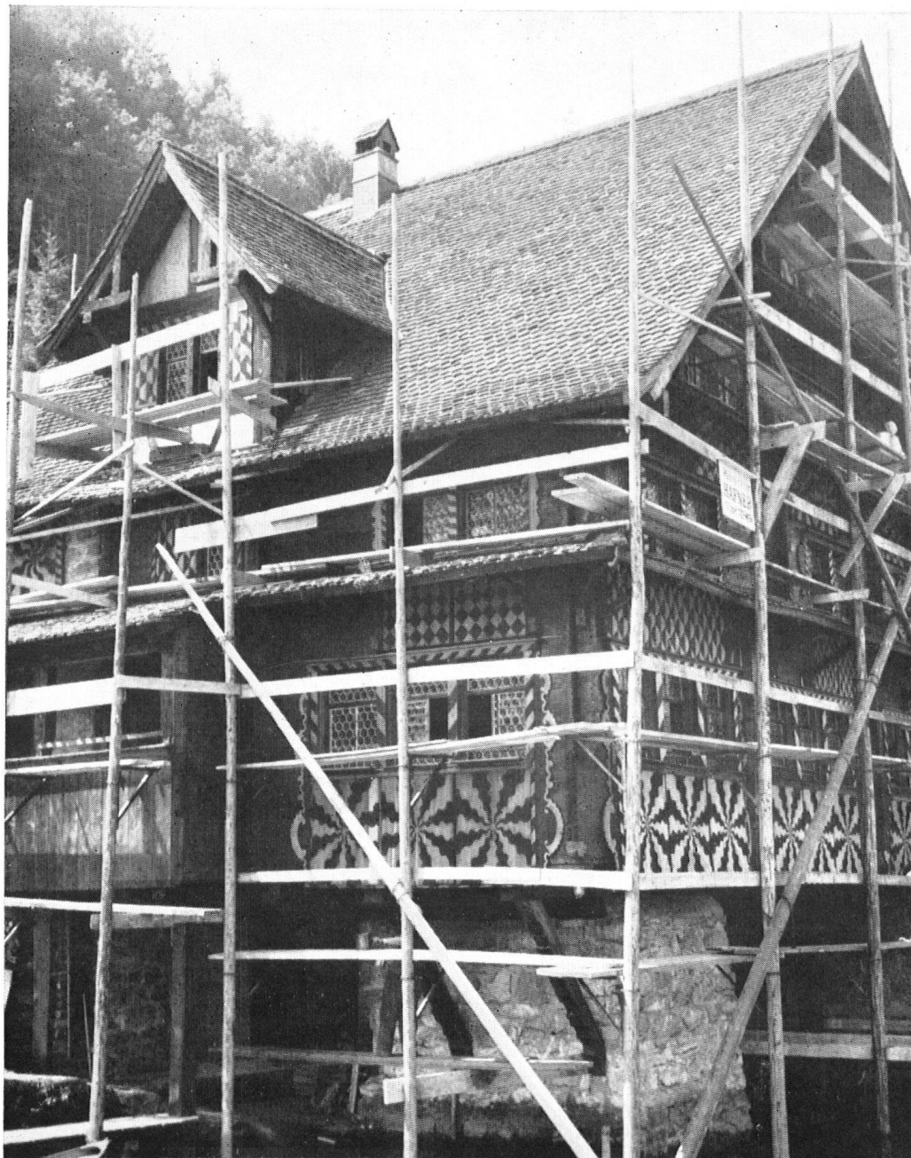
La maison des bateliers à Treib au début de l'été 1959. Un échafaudage permet d'atteindre la surface entière des façades.

et les couleurs des peintures avaient passé. Après l'enlèvement de la poussière et de l'ancienne couleur, avec un spécialiste de la conservation du bois et avec l'entrepreneur de peinture Hafner, de Seewen, on décida, sur l'échafaudage même, du traitement à appliquer. Trois à quatre couches d'une laque diluée donnèrent une nouvelle protection en nourrissant le bois.