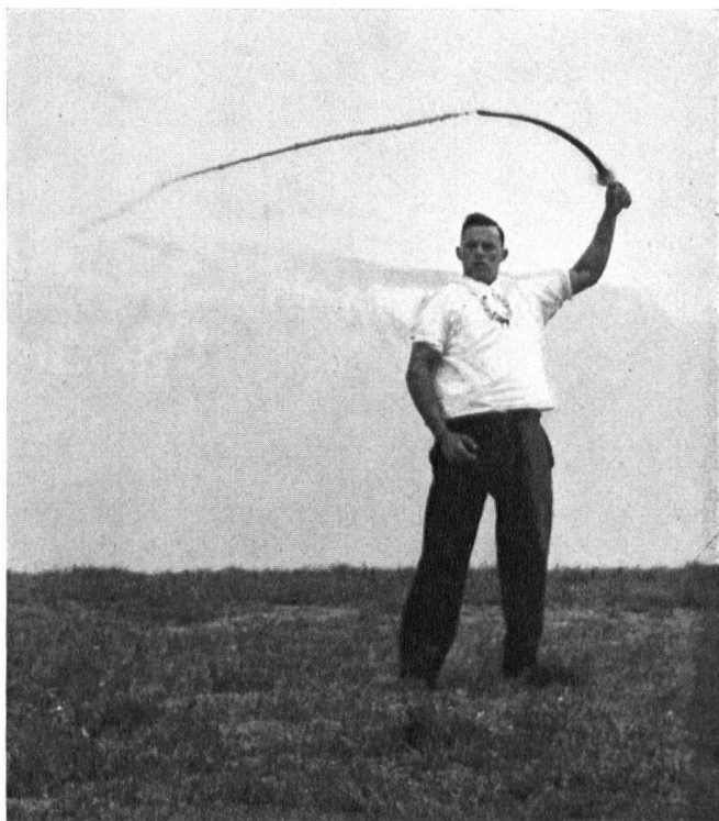
D'un bras vigoureux un berger d'Arth fait claquer son fouet, coutume ancestrale qui, au temps jadis, devait chasser les démons hivernaux. Il vient ici purifier la montagne.