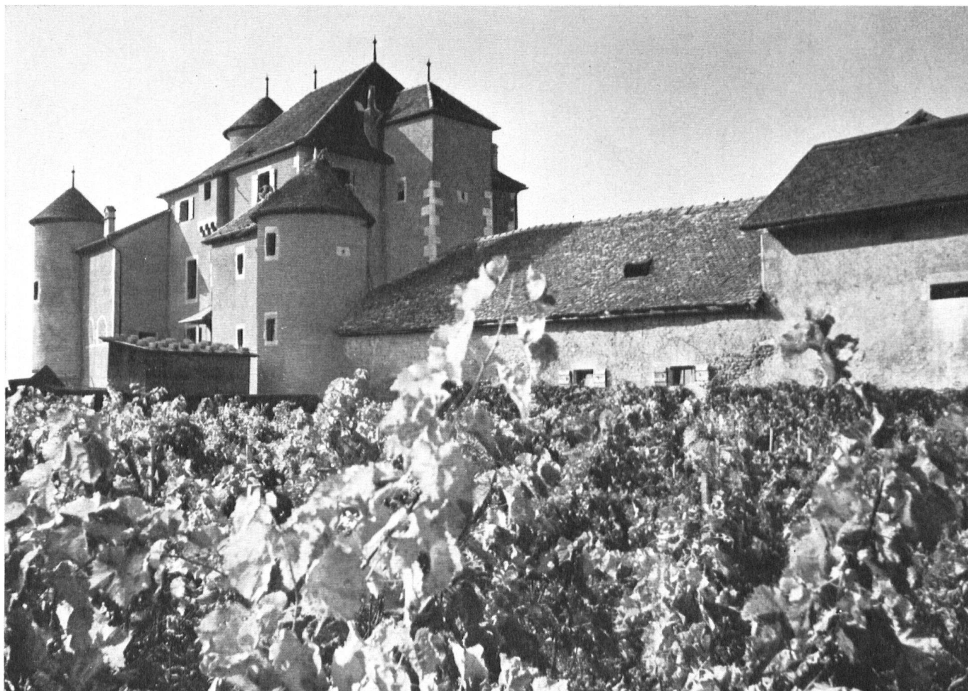
L'édifice, agrandi au XVe siècle, vient d'être restauré aux frais de l'Etat, par l'initiative de la Société d'Art public, section genevoise de la Ligue du Patrimoine national qui ont l'une et l'autre apporté leurs subsides (voir « Heimatschutz », 1952, p. 26 et 27).