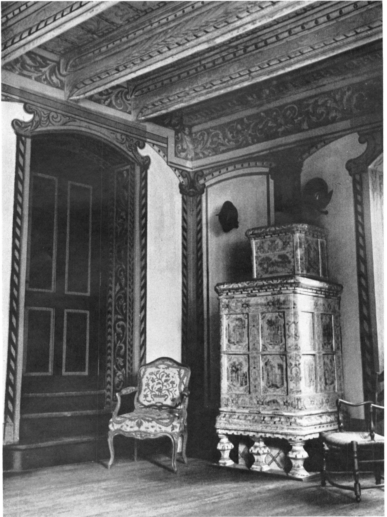
La salle des chevaliers de St-Jean, rénovée au XVII e siècle, par le commandeur Cordon d'Evieu probablement, est digne désormais d'accueillir comme autrefois des visites illustres.