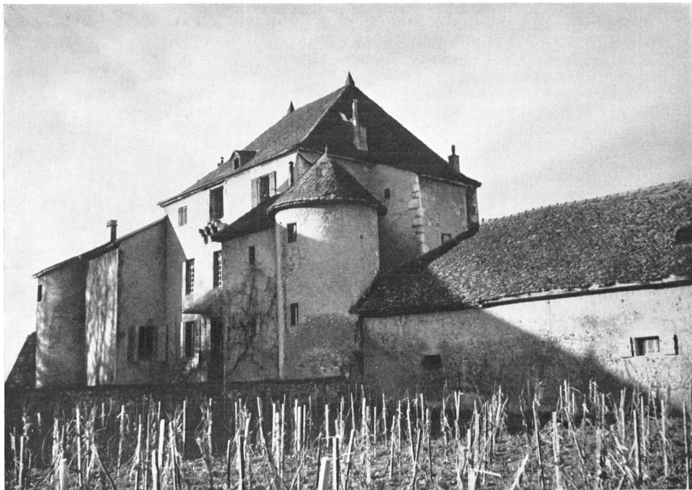
A quelques kilomètres de Genève et tout proche de la frontière française, la Commanderie de Compesières domine le petit territoire cédé au XIII e siècle par l'évêque de Genève aux Hospitaliers de St-Jean de Jérusalem.