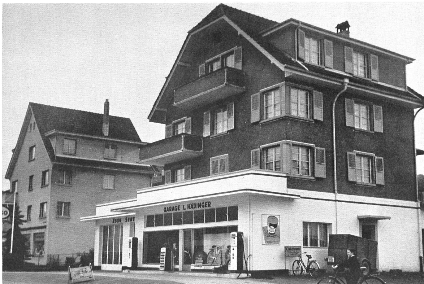
Les monstres présentés dans ces deux pages ont tous été photographiés entre Zurich et Lucerne. On a peine à comprendre qu'ils aient été admis par les règlements et les commissions d'urbanisme.