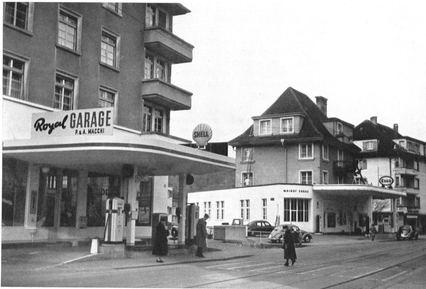
Il semble qu'on ait soulevé les maisons avec une grue, coupé leur base, pour y introduire les tranches d'un pâté douteux.