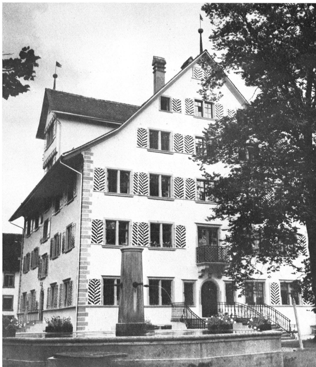
La maison seigneuriale où vécut Frédéric Hölderlin.

la fin de sa vie à Meersburg sur le lac de Constance. Toutefois le plus célèbre des habitants fut bien le poète Frédéric Hölderlin (1770—1843) avant que son génie eût été la proie de la folie.