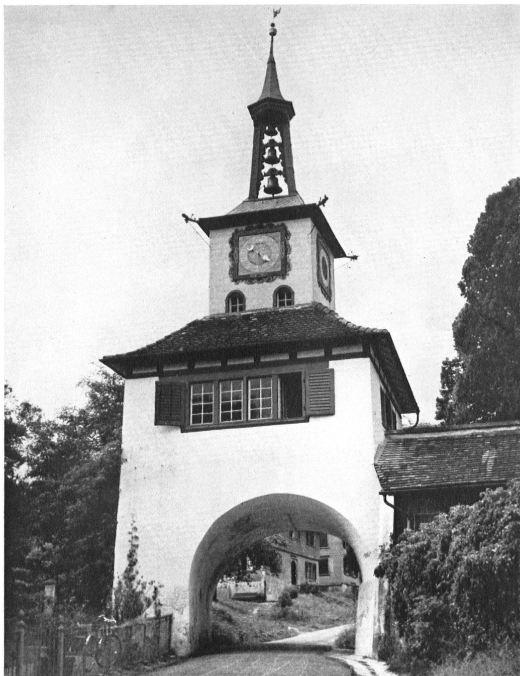
Le bourg minuscule de Hauptwil possède encore sa porte d'enceinte qu'il faut franchir pour accéder au château des Gonzenbach. L'horloge du maître zuricois Félix Bachofen n'a point démerité depuis l'année 1672.