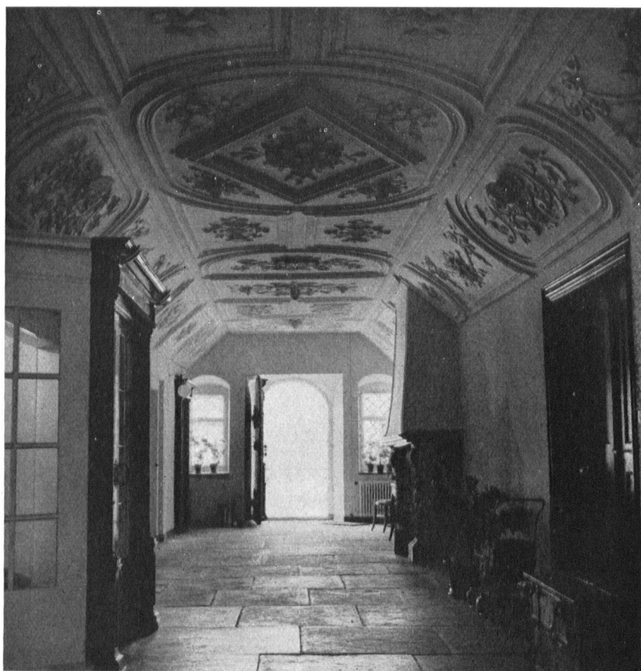
le hall du rez-de-chaussée, orné de stucs.