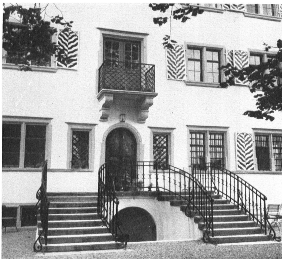
Le perron d'entrée et . . .