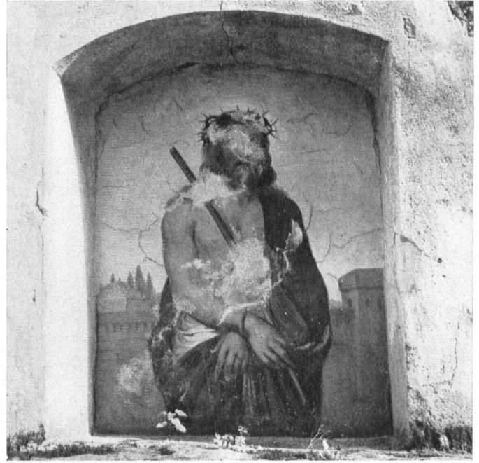
Camposanto in Soazza. Christus mit der Dornenkrone. Le Camposanto de Soazza. Le couronnement d'épines. Camposanto a Soazza. Cristo con la corona di spine.