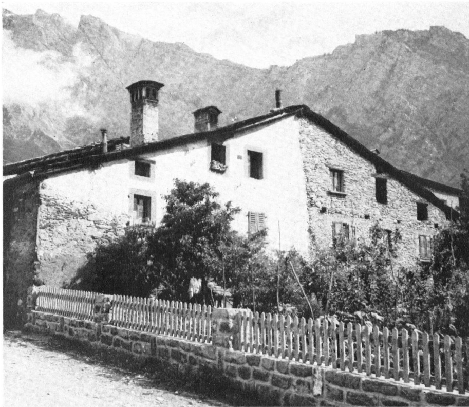
Chamoson-St-Pierre-de-Clages. La maison vigneronne classique. Traditionelles Weinbauernhaus (Doppelhaus). La tipica casa di un viticoltore a Chamoson.

notre vie paysanne. Voilà pourquoi nos villages conservaient une unité architecturale qui n'était certes pas sans grandeur ni sans beauté.