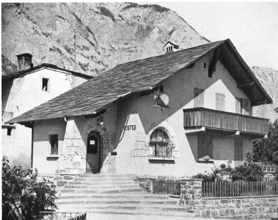
Les postes fédérales. — Pas de superfétations ni de poncifs, comme on en voit par centaines. Au logement du buraliste, s'accote le bureau que souligne largement le simple escalier. Die neue Post in Chamoson. Wenn man bedenkt, was ehemals für Postgebäude in die Dörfer gesetzt wurden, darf man sich über diese Lösung freuen. La Posta nuova a Chamoson. Quando si pensa a certi edifici postali rurali, bisogna convenire che questa è una soluzione soddisfacente.

Il faut que cet intérêt dont nous constatons avec grand plaisir les manifestations soit soutenu et dirigé. Il importe, avant tout, pour cela, que nous parvenions au plus tôt à une communauté de vues, à une unité de doctrine qui seule peut éviter les errements et les mécomptes.