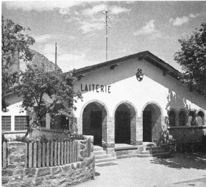
Chamoson voit surgir des bâtiments adaptés à leur destination où le style régional s'accorde à l'élégance. — La laiterie et son péristyle: le déchargement des « boilles » s'opère de plain-pied. Öffentliche Bauten im Walliser Ortsstil: die Molkerei von Chamoson. Beim Mittelbogen, ohne Treppe und Brüstung, stellen die Bauern ihre Brenten ab. (Auch hier vielleicht noch ein etwas Zuviel an Bogen. Das Motiv der Arkade würde wirkungsvoller zur Geltung kommen, wenn die Fenster daneben mit geraden Stürzen abgedeckt wären. Red.) Edifici pubblici nello stile locale: la latteria di Chamoson. Sotto l'arco di mezzo i contadini depongono le loro brente.

et à l'abri du soleil. Le réseau général d'égouts assurera l'écoulement des trop-pleins éventuels des fosses à purin.