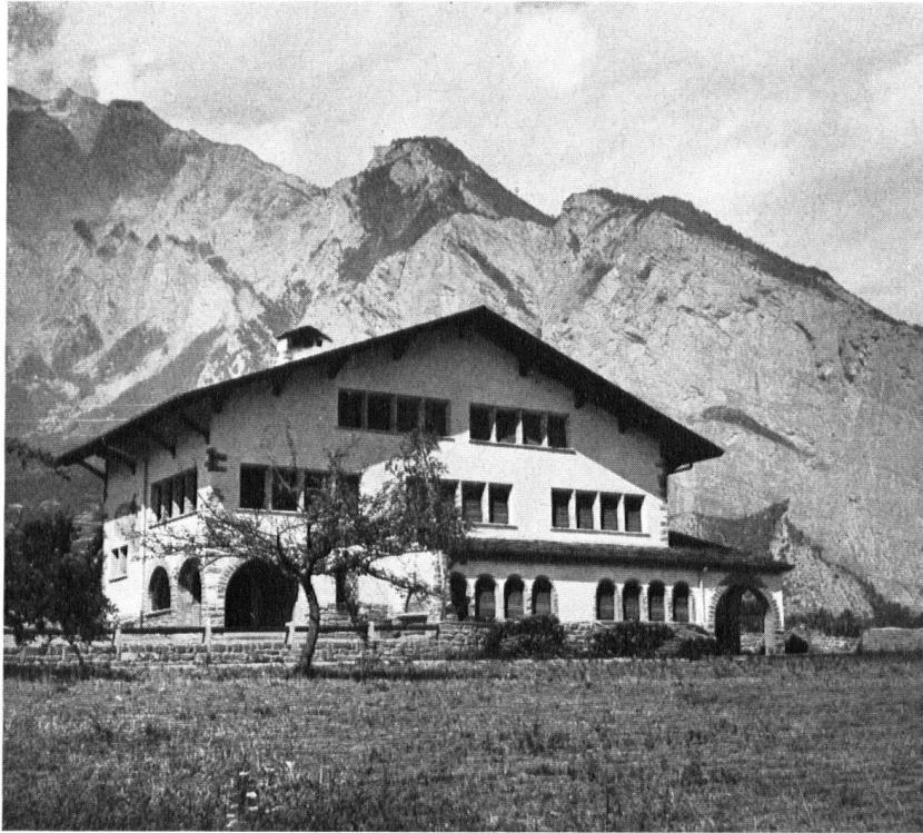
Entre l'école de Chamoson et celle de St-Pierre-de-Clages, nouvellement édifiée, quelle distance! Die neue Schule von St-Pierre-de-Clages (vergleiche Seite 106, oberstes Bild!). Schöner, breit gelagerter Baukörper unter wuchtigem, landesüblichem Dach. (Einzig das Bogenmotiv der Fen- ster am Vorbau wirkt dazu noch etwas schwächlich. Red.). La nuova scuola di St-Pierre-de-Clages (confr. l'illustrazione a pag. 106, in alto).

plus d'air, d'espace et d'indépendance, tout cela conduit le village à déborder ses propres limites pour se répandre dans la campagne.