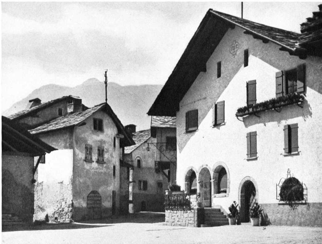
Une ruelle où l'on peut faire encore de belles découvertes. Kirchplatz von St-Pierre-de-Clages. Blick in die winkligen Gassen des alten Dorfkernes. Rechts das Haus Giroud. Il piazzale davanti alla chiesa di St-Pierre-de-Clages e un vicolo dell'antico villaggio.

« A la maison » n'est pas la réponse de l'enfant seul. Ce n'est pas seulement une réponse enfantine. C'est une réponse humaine. C'est la réponse que fait ou voudrait faire tout homme qui recherche, avec le repos du corps et de l'esprit, la sûre et douce et chaude protection des forces et des tendresses tutélaires qui veillent sur les fragiles bonheurs humains.