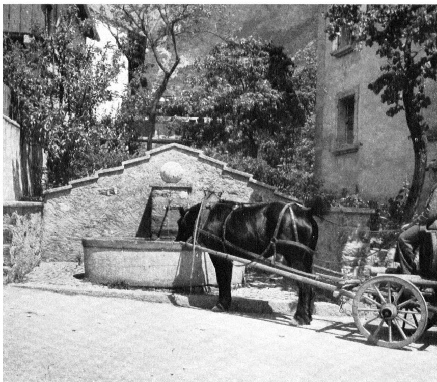
St-Pierre-de-Clages. Une fontaine moderne qu'approuve l'esprit du lieu. St-Pierre-de-Clages. Versuch, einen neuen Dorfbrunnen ins Ortsbild einzupassen. St-Pierre-de-Clages. Tentativo di armonizzare una nuova fontana con l'ambiente.