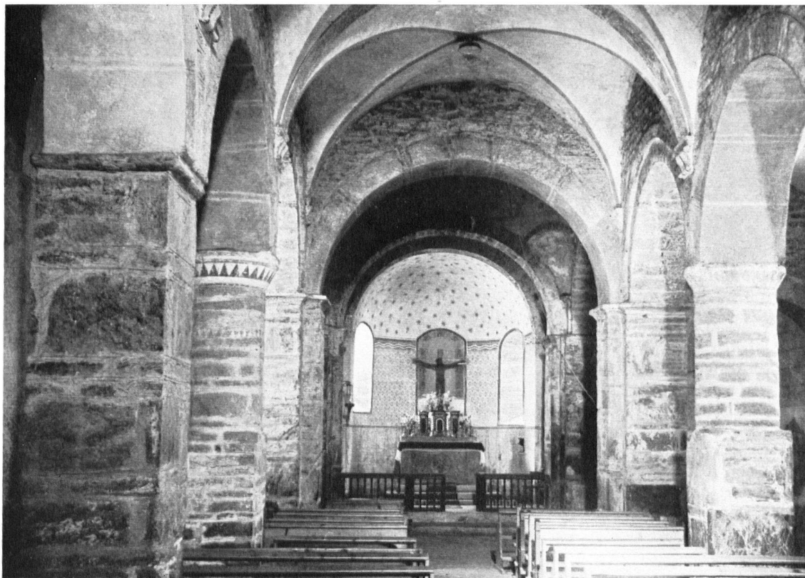
La nef de St-Pierre-de-Clages avant les travaux. St-Pierre-de-Clages, Das Innere der Kirche vor der Erneuerung. Come si presentava l'interno di St-Pierre-de-Clages prima dei lavori.

cire. Il fait bon s'arrêter un instant à l'ombre de ces murs presque millénaires, il fait bon, l'été, pénétrer dans la fraîcheur du sanctuaire. D'admirables surprises, d'ailleurs, nous y sont réservées.