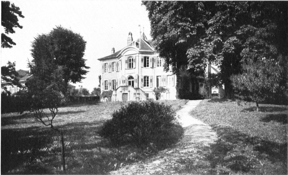
La façade du château tournée vers le jardin où l'on est tenté d'oublier que l'on est en ville, tant apparaît intact le décor où évolua, au XVIII e siècle, l'aimable société bourgeoise qui peupla de pareilles demeures les « campagnes » lausannoises. Blick vom Garten auf das im 18. Jh. angebaute herrschaftliche Wohnhaus. La facciata del castello che dà sul giardino e fa dimenticare la città per riportarci nell'ambiente tanto caro alla distinta borghesia losannese del XVIII secolo

Im 18. Jahrh. war Lausanne umgeben von einem Kranz herrschaftlicher Häuser und Gärten. In ihnen lebte die kultivierte, der Kunst, der Wissenschaft und den feinen Sitten ergebene »gute Gesellschaft« der Stadt. Dabei verstand man es meisterhaft, die oft noch aus dem Mittelalter stammenden Teile dieser Herrnsitze durch Um- und Anbauten dem eleganten und zierlichen Geschmack der Zeit anzupassen. Béthusy ist ein schönes Beispiel dafür. Die Nordseite erinnert mit ihren beiden Türmen an ein Manoir des 16. Jahrhunderts, dem im 18. Jahrh. nach der Gartenseite hin ein herrschaftliches Wohnhaus im Stile der Zeit angefügt wurde. Die ganze Besetzung gibt dem im übrigen ziemlich chaotischen Quartier von Neu-Béthusy heute noch einen vornehmen Mittelpunkt.