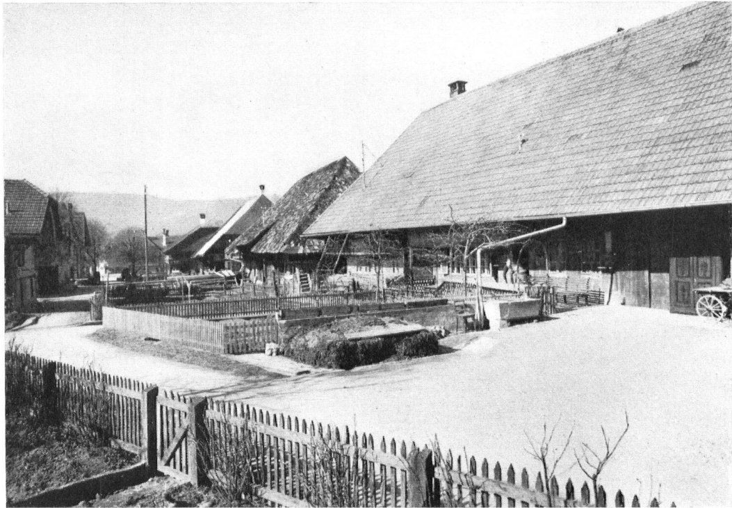
Die Dorfasse, wie sie vor kurzem war . . .

La rue du village, telle qu'elle était tout récemment encore.