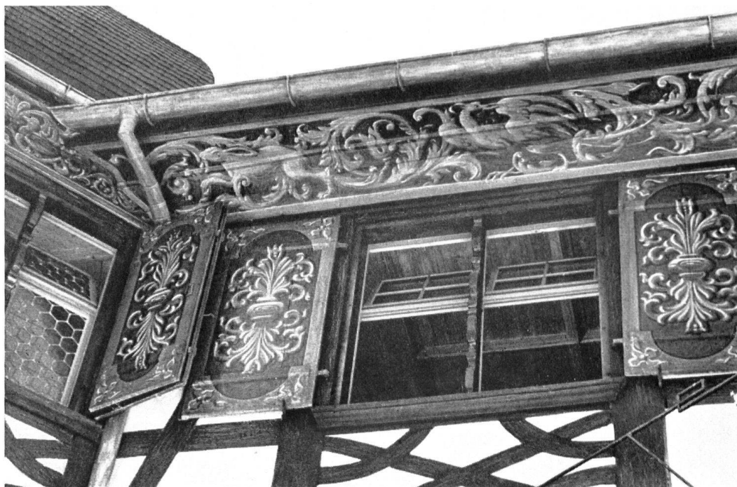
Die renovierten Malereien am Dachgesimse. Les peintures à la détrempe des volets et de l'avant-toit.

Das Innere verrät in seiner Raumeinteilung den selbstbewußten bürgerlichen Bau- stolz des 17. Jahrhunderts. Vom geräumigen Hausflur mit einer leichten Eichensäule führt eine Balustertreppe zum oberen Vorraum und von diesem in die wohlpropor- tionierten Erkerstuben und übrigen Räume, die freilich, mit Ausnahme eines nach hinten liegenden kleinen Saales wenig mehr an Getäfel oder Decken aufweisen . . . »