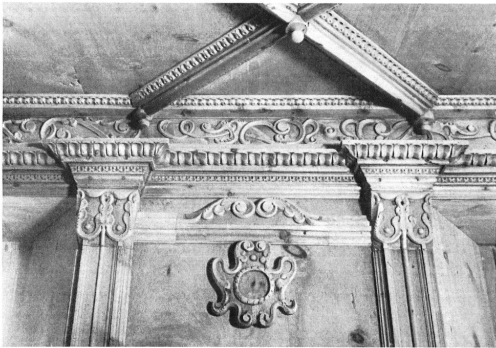
Einzelheit des Getäfers der Stube aus Sent, jetzt im Plantahaus Samedan.

Ces communes se nomment Sent et Samedan ou, ainsi que nous disions naguère, à l'allemande, Samaden. En somme deux chefs-lieux. Le premier l'emportait autrefois sur tous les bourgs de l'Engadine, et se contente aujourd'hui de sa prééminence sur le pays inférieur, alors que Samedan règne sur le haut pays.