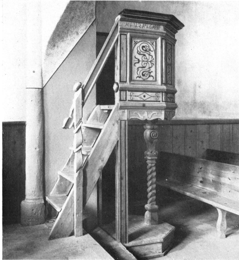
Kanzel aus der Kapelle San Bastiaun in Samedan, heute in der reformierten Kirche zu Sent. La chaire de San Bastiaun, église démolie de Samedan, a trouvé place dans celle de Sent, après un séjour aux caves du Musée National.