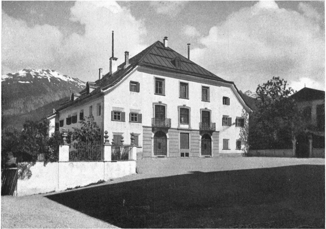
Das Plantahaus. Schauseite gegen den »Plazet«, wie sie im Jahre 1870 erneuert und verunstaltet wurde.

La maison de Planta sur le « Plazet » avait subi, en 1870, quelques modifications fâcheuses.