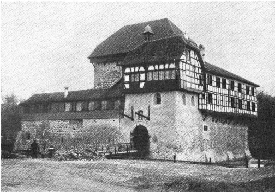
Das Schloss Hagenwil mit Tor und Zugbrücke von Süden.