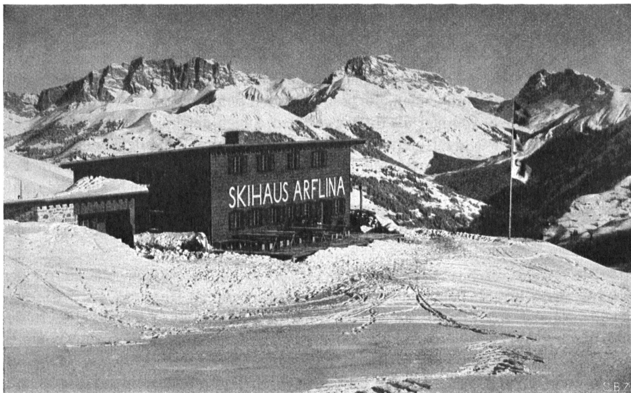
Skihaus Arflina in den Fideriser Heubergen, 1935. Skelettbau mit horizontaler Schalung. Bedachung Kupferblech. Einstöckiger Skiraum massiv. Rud. Christ, Arch. B. S. A., Basel. Cabane pour skieurs près de Fideris, Grisons. Construite en bois par R. Christ, architecte, Bâle. Couverte en tôle de cuivre. Le magasin pour les skis, à un étage, en pierre.

steins. Die Einführung des elektrischen Lichtes ist zwar eine allgemeine geworden, doch dürfen wir uns nicht verhehlen, dass gerade in den alten und enggebauten Gebirgsdörfern noch Schindeldächer mit hölzernen Kaminhüten und Holzherde vorhanden sind. Eine Wiederaufhebung der harten Bedachung für Neubauten wird deshalb in Anbetracht des Flugfeuers kaum durchdringen können. Hingegen wäre seit den Brandversuchen der LIGNUM die Wahl zwischen harter oder weicher, gegen Feuer imprägnierter Aussenhaut anzustreben, bei offener Bebauung sogar die gewöhnliche weiche Aussenhaut. Dementsprechend würde jeder Kanton in drei Zonen eingeteilt: 1. Stadtkerne mit Holzbauverbot; 2. Vorstädte mit Holzbauerlaubnis unter gewissen Bedingungen und 3. Dörfer- und Weiler mit Holzbau unter gewissen Bedingungen bzw. völliger Freiheit. Ueberall gleiche Abstände wie für Massivbau. Für Reihenhäuser werden Trennwände mit beidseitigen Holzwoollplatten an Stelle der nassen und unorganischen Brandmauern vorgeschlagen.