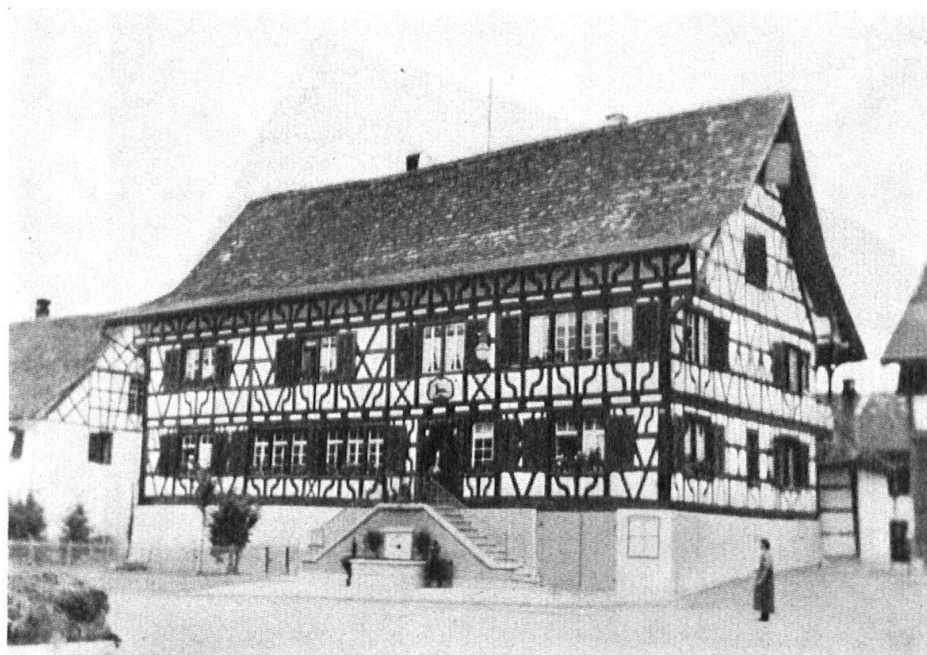
Haus zum Hirschen in Marthalen, Kanton Zürich, 1715. Wiederhergestellt durch Architekt Largiadèr in Riehen-Basel. Beispiel eines sichtbaren Riegelbaus der Spätzeit. Die geschweiften Hölzer sind nur 6 cm dick und rein dekorativ. Fassadenriegel in Eiche. Bedachung Handziegel; einfache Dekkung.