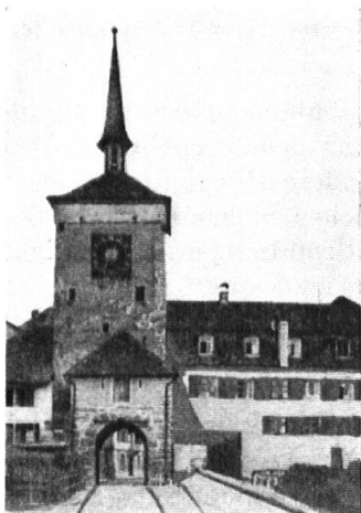
Erweiterung von aussen. Projet d'élargissement. Vue de l'extérieur.