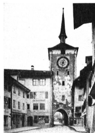
Alter Zustand, von innen. Etat actuel. Vue de l'intérieur.