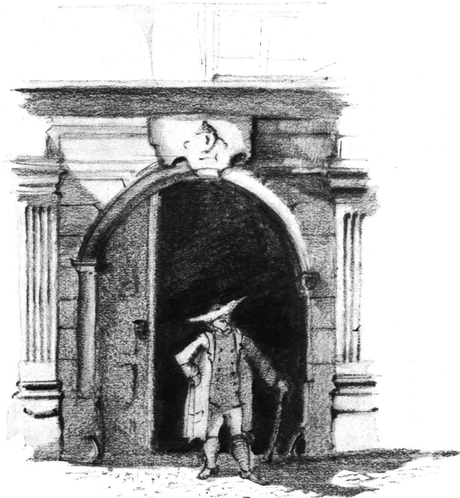
Eingang zum Zellwegerhaus. — Entrée d'un Palais des Zellweger.